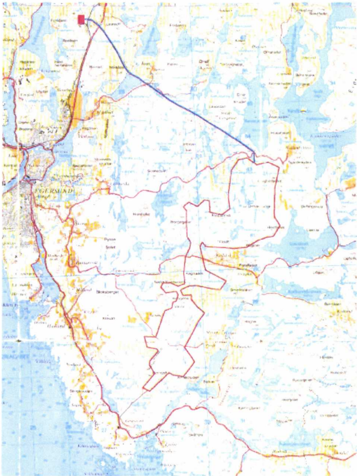
Egersund vindkraftverk - kart over planområde og nettilknytning