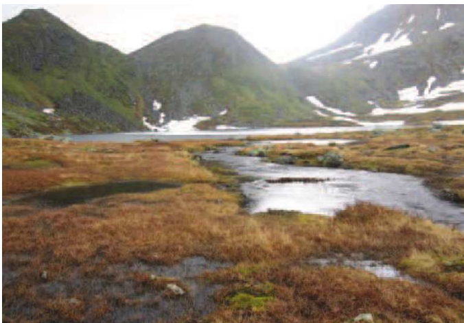
Planlagt plassering av inntaket nedenfor utløpet av Rismålsvatnet

Rørgaten vil i sin helhet være nedgravd, og totalt ha en lengde på ca 4000 m. Grunnet høyt trykk vil man bruke støpejernsrør, eventuelt med GRP rør øverst ved inntakene hvis dette er økonomisk fordelaktig. Rørgaten vil gå dels i fjell og dels i løsmasser. Stedlige masser vil brukes til gjenfylling av grøft, samt påfølgende arrondering.