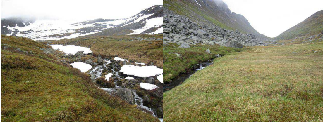
TERRENGFORHOLD VED PLANLAGT INNTAK I MELLOMELVA (TIL VENSTRE) OG YTRÅGA (HØYRE)

Fra inntaket i Mellomelva, vil røret følge vassdraget ned til samløpet med Heimstadelva, der rørene kobles sammen. Rørtraséen fra inntaket i Ytråga kobles sammen med hovedrørledningen ved pumpestasjonen på kote 260. Fra Heimstadelvas samløp med Kjerringåga, går røret i felles grøft