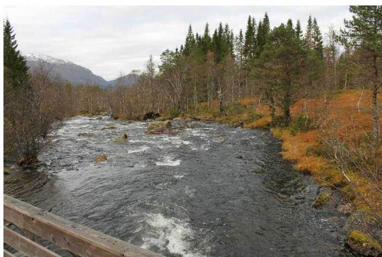
Foto nr. 11 i søkn. Elva sett nedover fra Stokkebrua, inntaksområdet til høyre