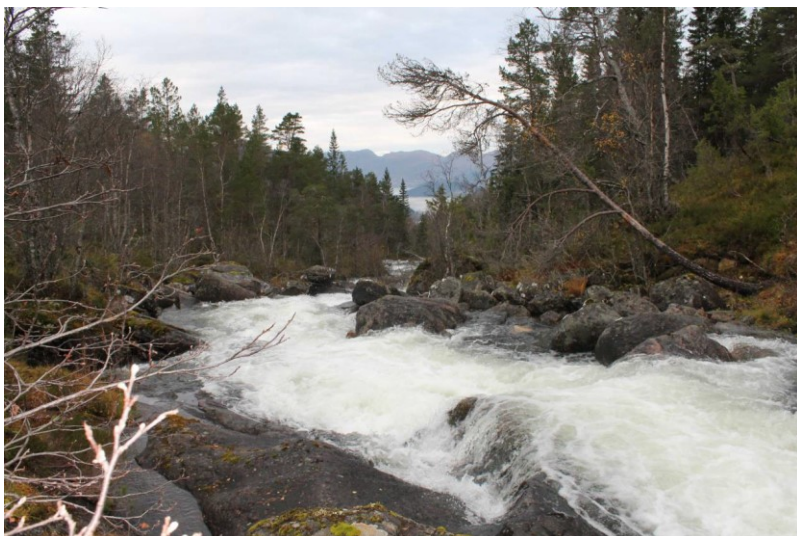
Foto nr. 10 i søknad. Frå vestsida av elva ca. 100 meter nedanfor inntaket.

Ved inntaket skal det byggast ein ca. 1 meter høg og 15 meter lang terskel tvers over elva. Terskelen vil demme opp eit areal på ca. 200 m 2 med volum ca. 200 m 3 . Inntakskanalen ved sida av elva vil bli 3 meter djup og 10 meter lang. Øvre delen av rørgata skal leggjast i skråninga mellom elva og vegen. Vidare nedover i skogsterreng og over eit dyrkingsfelt til planlagt kraftstasjonen med grunnflate 70 m 2 på kote 92. På same nivå, men på andre sida av elva, skal kraftstasjonen til Breidalselva kraftverk byggast. Det må byggast ca. 50 meter anleggsveg til inntaket frå eksisterande veg og ca. 50 meter permanent veg til kraftstasjoen frå eksisterande veg. Tilknytning til eksisterande nett er planlagt med ca. 600 meter jordkabel.