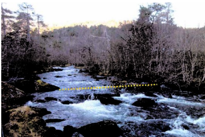
Inntaksområdet. Terskel er skissert.