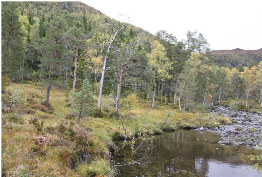
Kraftstasjonen er planlagt midt i bildet.

Frå kraftstasjonen med grunnflate ca. 70 m 2 er det planlagt 637 meter jordkabel (22 kV) ned til inntaket til det planlagde Røyrvik kraftverk og 640 meter kabel liggande i felles grøft med rørgata til dette kraftverket. Vidare frå den planlagde kraftstasjonen ved Røyrvikvatnet skal det leggjast om lag 200 meter felles kabel fram til ei eksisterande kraftlinje.