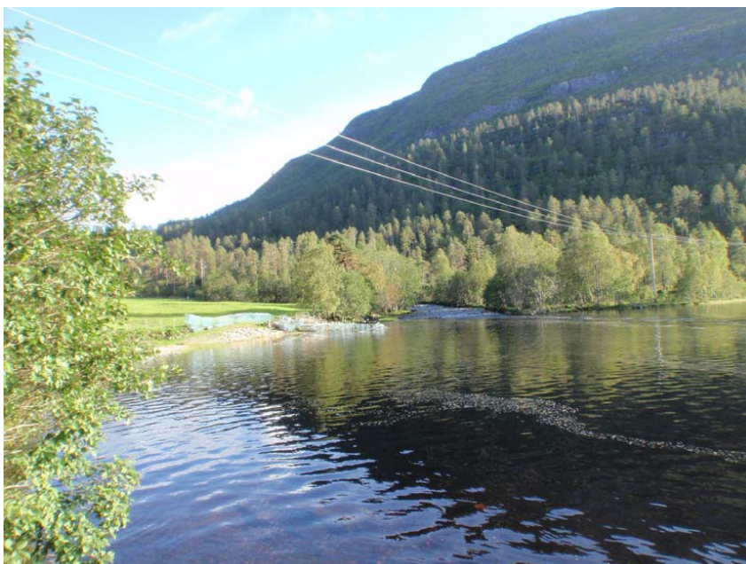
Kraftstasjonsområdet på dyrka mark ved Røyrvikelva sitt utløp i Røyrvikvatnet.