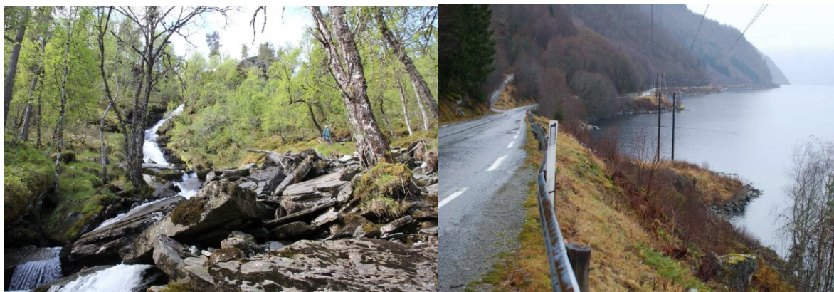
Venstre: Vetebrattstigen. Høgre: Kraftstasjonen er tenkt plassert på neset nær kraftlinja.