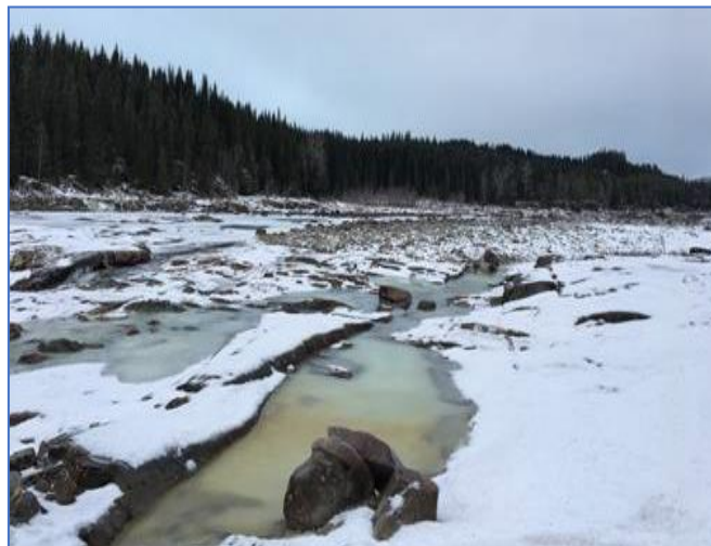
Figur 2: Bilde fra nedstrøms Aunfoss vinter-2017/18 ved lavvannføring.