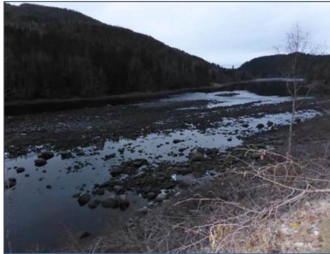
Figur 1: Bilde fra lavvannføring ved Tørrisdal 07.11.2013.

To eksempler på lavvannføring og påfølgende tørrlagte områder i Namsen nedstrøms Nedre Fiskumfoss (Figur 1), og nedstrøms Aunfoss (Figur 2). Miljøskadene kan være betydelige, men er ikke undersøkt til NE sin kjennskap. Miljøvirkninger av slike tørrlegginger mener NE bør og skal undersøkes.