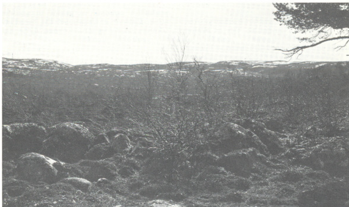
Karpelva, parti med småvokst bjørkeskog.