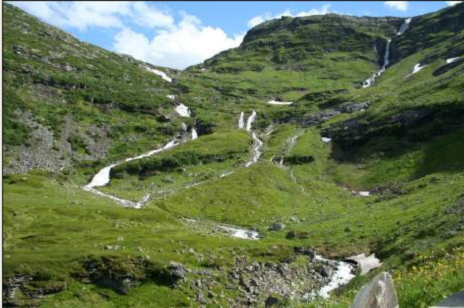
Sideelver i forgreinet elveløp i øvre del av vassdraget.

Vernet i Verneplan for vassdrag i 1993 (Verneplan IV).