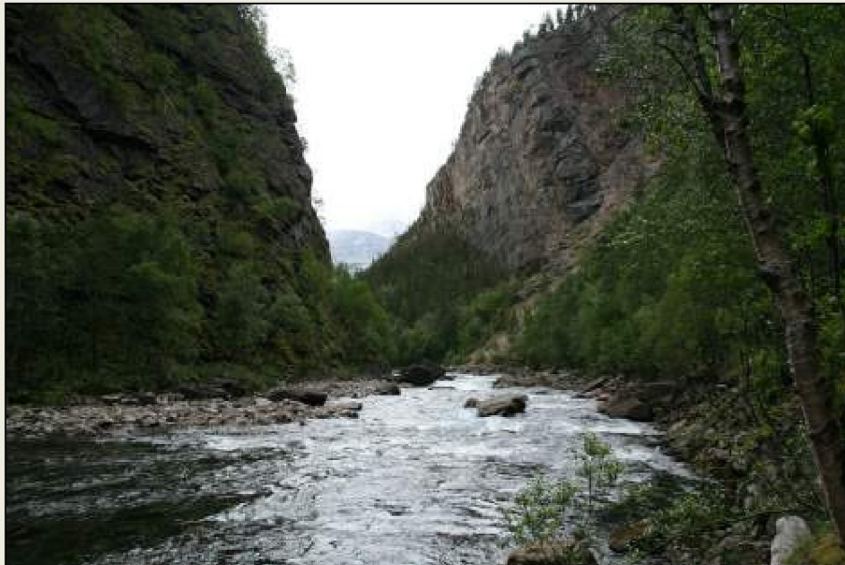
Elva renner i stryk gjennom den dype kløften.

Junkerdalen er sidedal til Saltdalen. Mellom den flate Junkerdalen og Storjord renner elva i en dyp kløft, kalt Junkerdalsurda. Området er fredet som naturreservat.