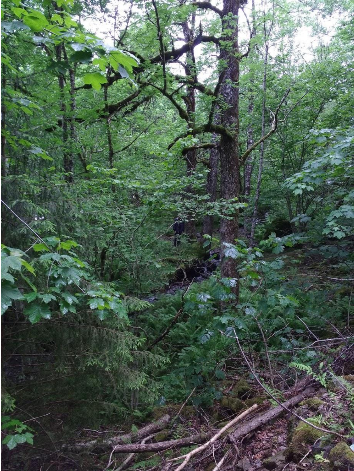
Figur 3 - I området er det 6 ask mellom 150 - 175 cm i omkrets. Kløppabekken, bregneområdet.