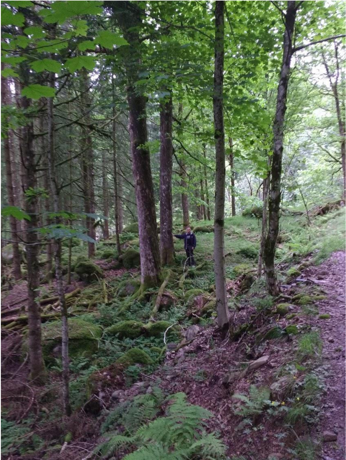
Figur 2 - Lind omkrins 195 cm. Eik omkrins 247 cm. Stad: Trøa