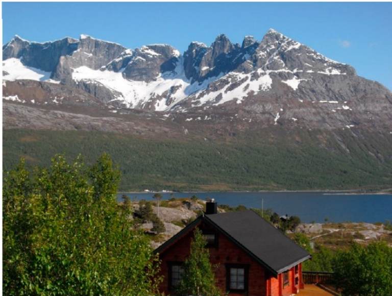
Figur 2 viser et bilde som er tatt fra Holmsundøy med Tindåga og Småtindan på andre sida av fjorden.

Like oppstrøms planlagt kraftstasjon er det en foss, som konsulent (SWECO) har vurdert at ikke faller inn under naturtypen «fossesprøytsone», på grunn av mangelen på stabile fuktighetsforhold og sjeldne, spesialiserte og fuktighetskrevende arter. Fylkesmannen og Forum for natur og friluftsliv (FNF) er noe uenige med konsulentens vurdering, og mener at redusert vannføring vil virke negativt på livet rundt fossen. NVE er enig med fylkesmannen og FNF i sin vurdering, og mener at fossen og tilhørende vegetasjon innehar kvaliteter som skiller seg ut fra landskapet ellers.