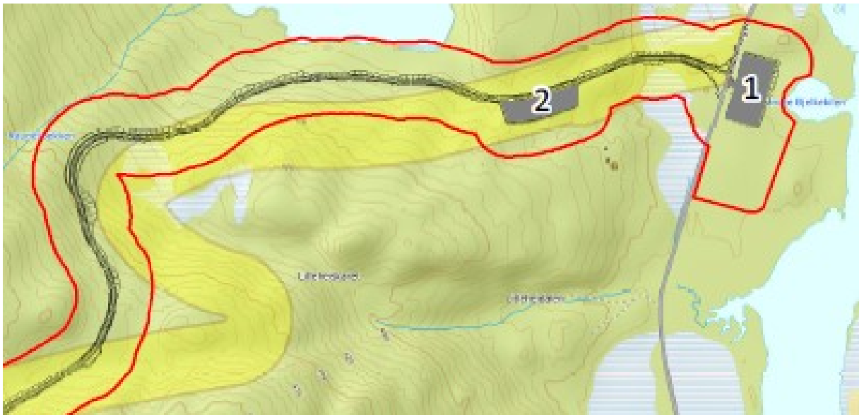
Figur 2: Omsøkt endring (rød linje markerer ny arealbruksgrense) sammenlignet med tidligere godkjent arealbruksgrense (gult felt).

Søknad datert 17.03.2020 omfatter 1050 meter av adkomstveien lengst øst mot Fv465, og et massetak/areal for servicebygg (M2). Både delen av adkomstveien og massetaket overlapper nesten helt med tidligere godkjent trasé, jf. Søknad om planjustering for adkomst- og internveger, datert 14.02.2020. Se figur 2.