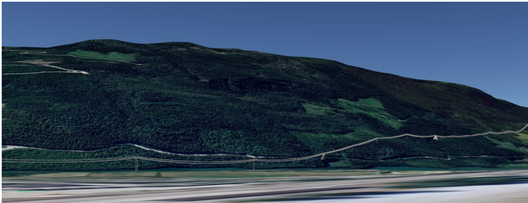
Utsnitt fra 3D modell i Google Earth. Masterekk på alternativ 1 sett fra Ringebu. Linene vil ikke bli så synlig som på modellen, men er gjort synlige for å bedre illustrere hvor traséen går.