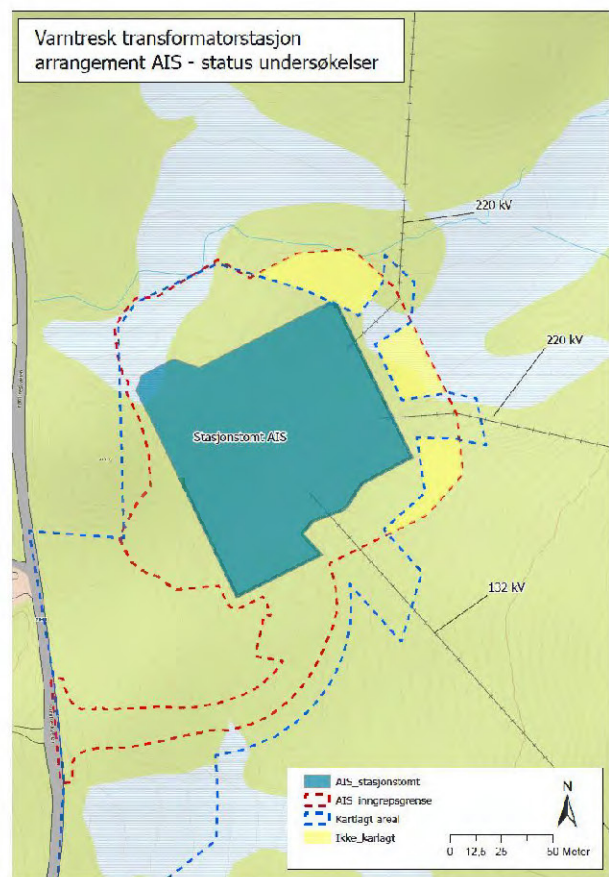
Figur 2 – status undersøkelser