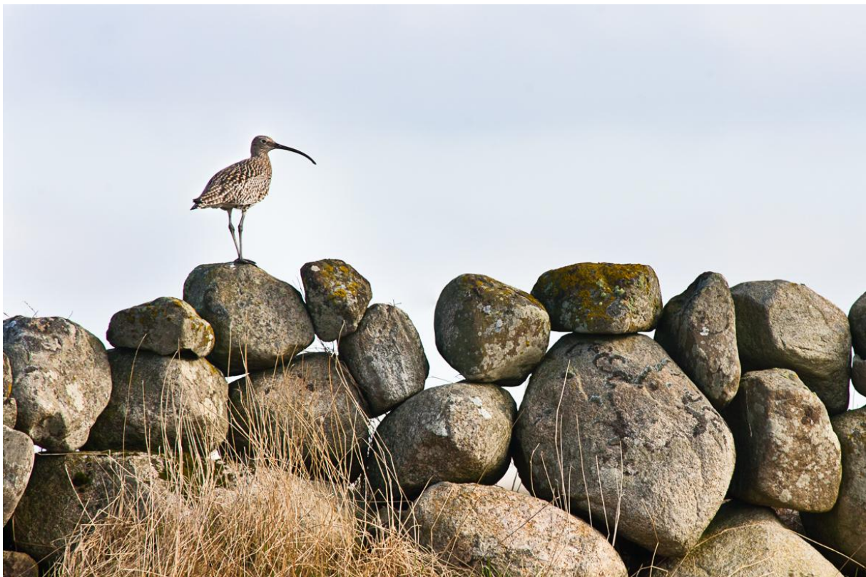
Figur 3.1. En vuktende storspove hann på en hekkeplass.

De aller fleste storspovene som hekker i Norge, overvintrer utenfor Norge. Våtrekket forekommer i mars-april, mens høsttrekket skjer i perioden medio juni – oktober. Hunnene forlater hekkeplassene når ungene er små, og overlater da ungepasset til hannen. Ungene finner uansett maten selv, men hannene har tilsyn med dem til de er flygedyktige. I juli -august forlater også hannene hekkeområdene, men også ungene forlater hekkeområdene i denne perioden.