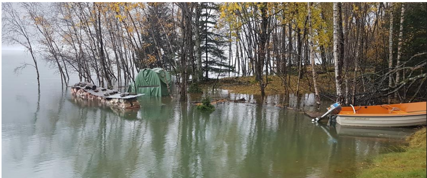
Leiteøyna kl 14:13