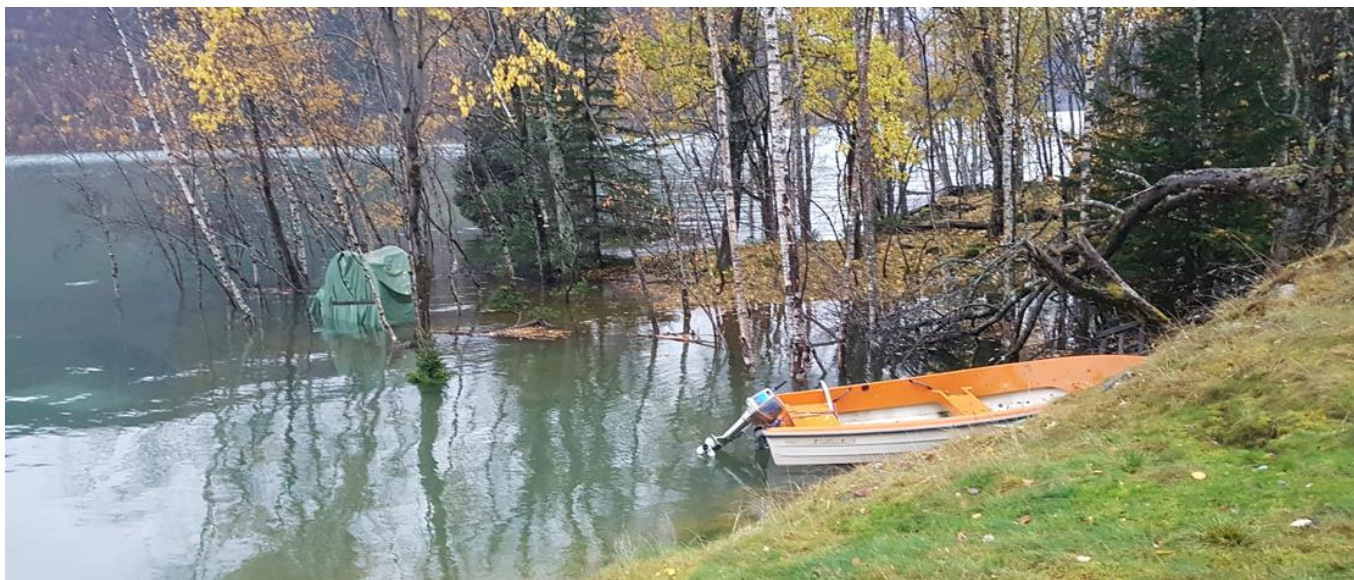
Leiteøyna kl 17:47 – ganske så oversvømt.