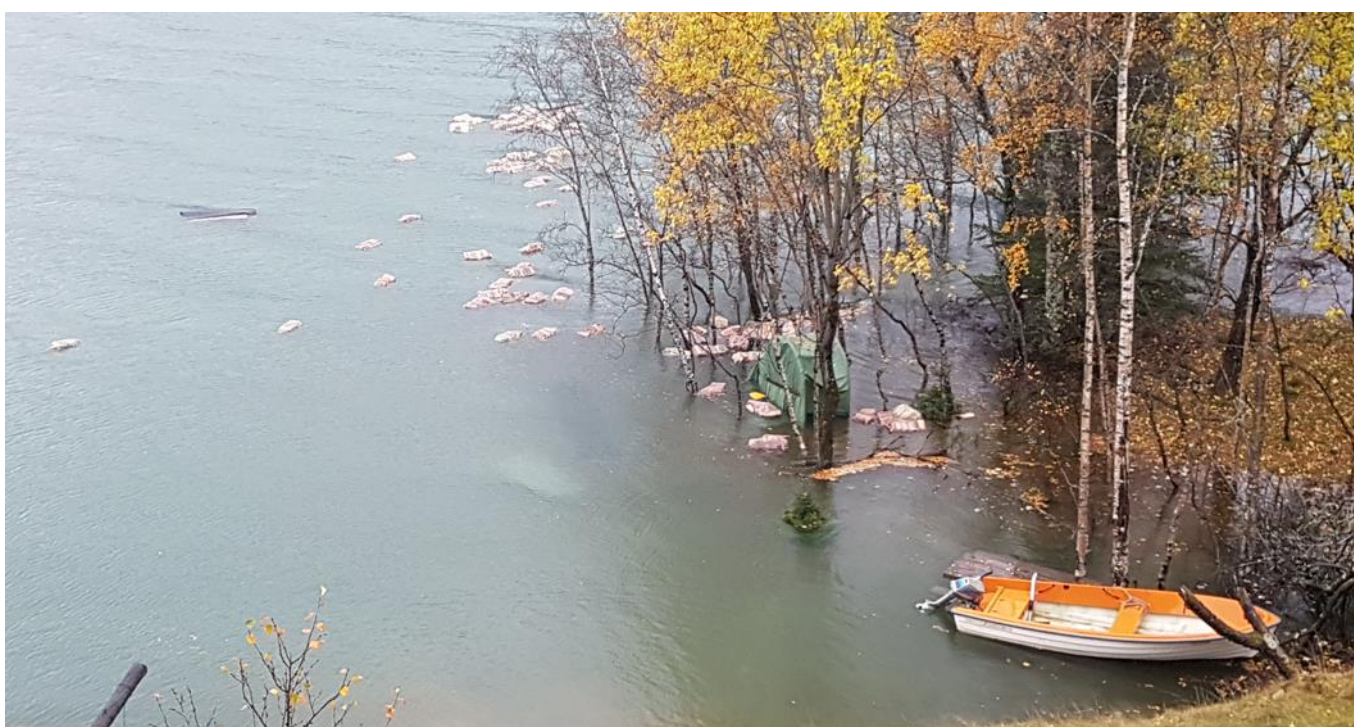
Leiteøyna kl 16:23 – 70 sekker ved flyter avgårde