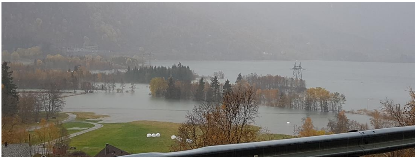
Inne i Røldal, ved Sein kl 10:41

Vatnet steig fort, ingen tiltak såg ut til å være gjort, regulanten reagert alt for seint og dei var ganske avvisande e ifbm info og innrømmelser i ettertid. Vatnet var iflg det vi kjenner til minst 1.8 m over HRV.