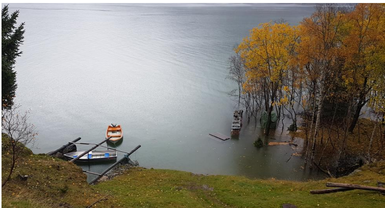
Leiteøyne kl 11:46 – nedre del av eiendommen er i ferd med å drukne.