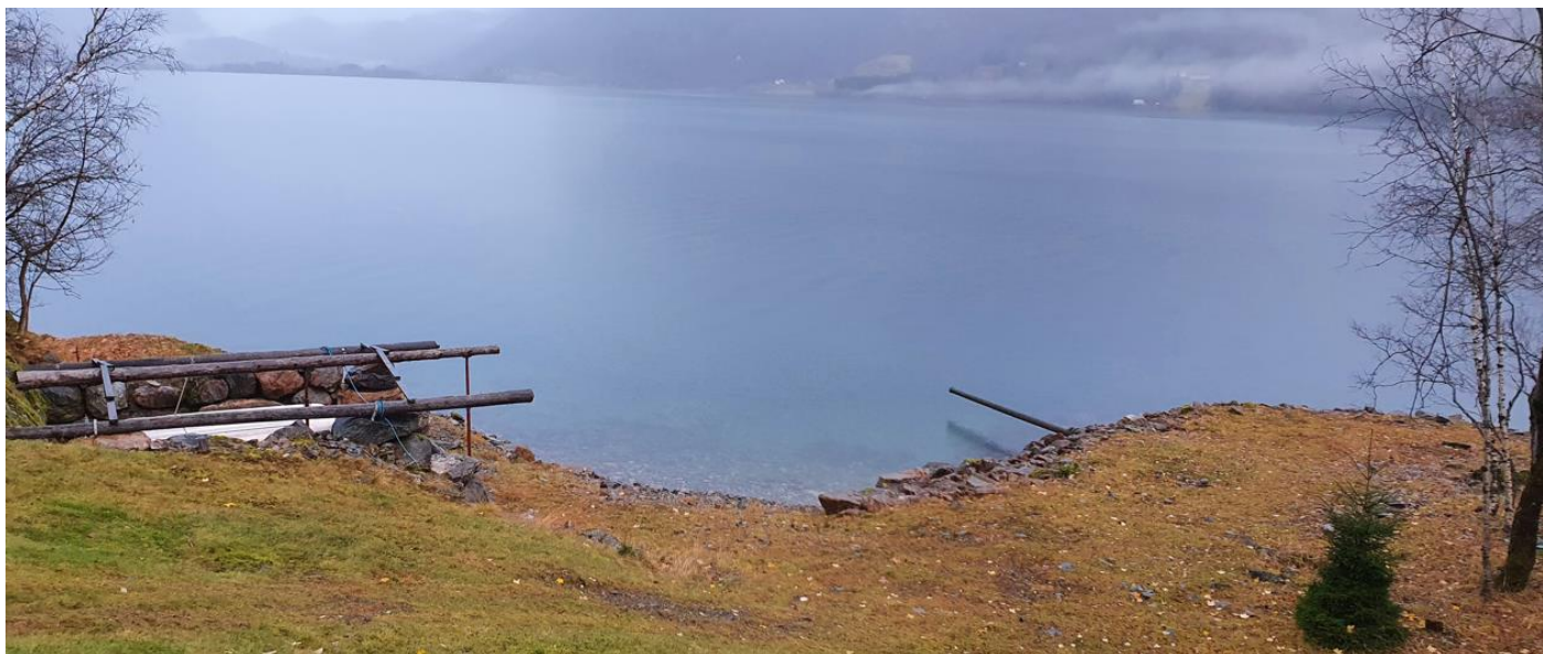
Samme sted 5.nov – røldalsvatnet ca på HRV.