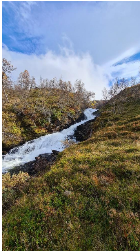
II) Elv frå Lomatjørn sett frå Svorteviki nord – vest