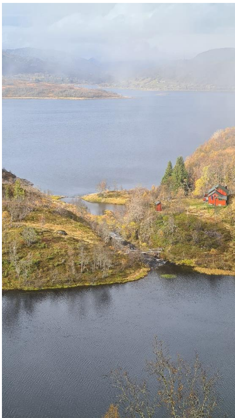
II) Elv frå Lomatjørn sett frå sør aust