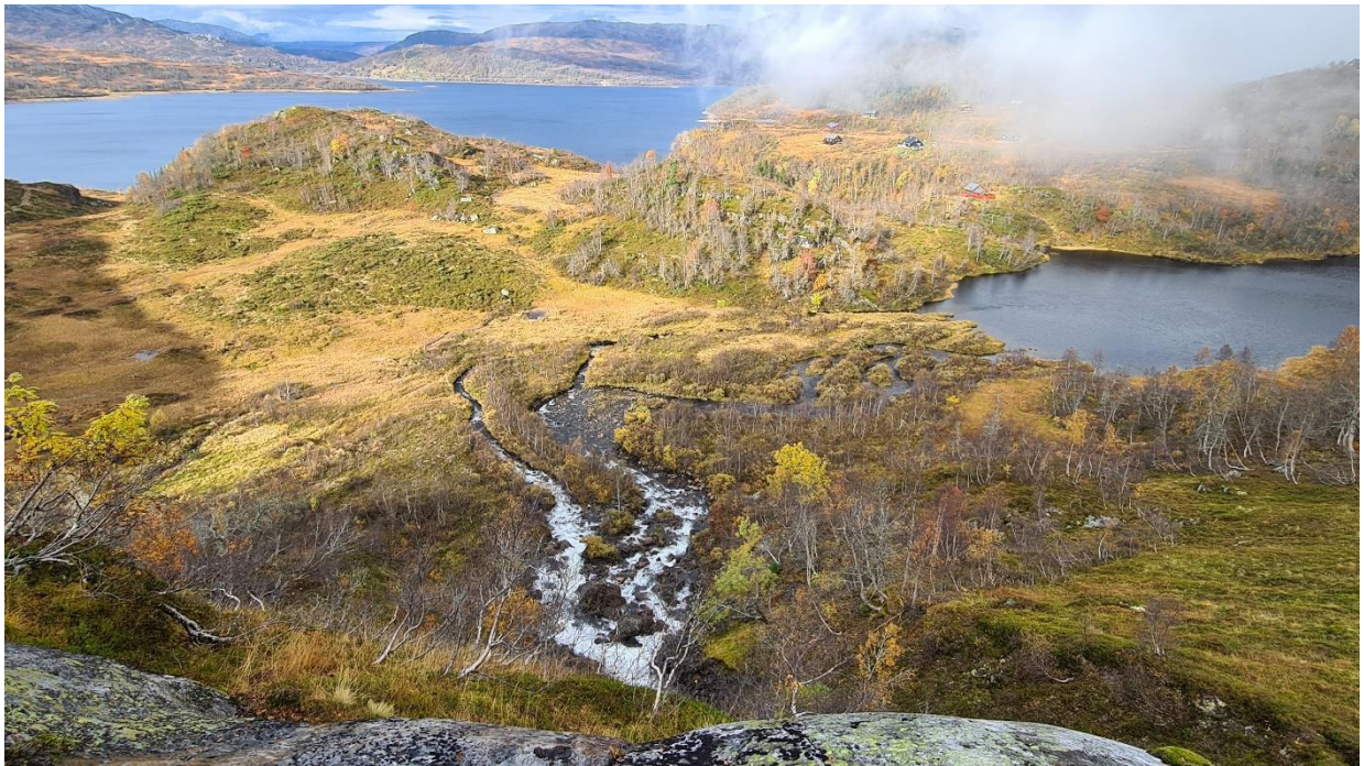
I) Flaumsletta ved Lomatjørn frå sør-aust (mykje større enn avmerka område på aktsemdskart, vedl. 3)