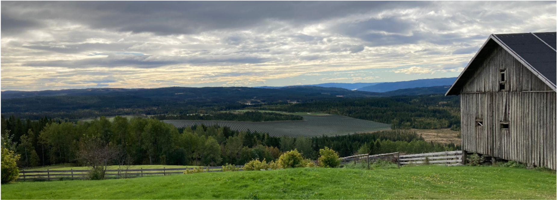
Figur 5 viser kraftverket sett fra lengre hold oppe i dalsida.

Kraftverket sett fra tunet på Seval Gård, fotostandpunkt 1: