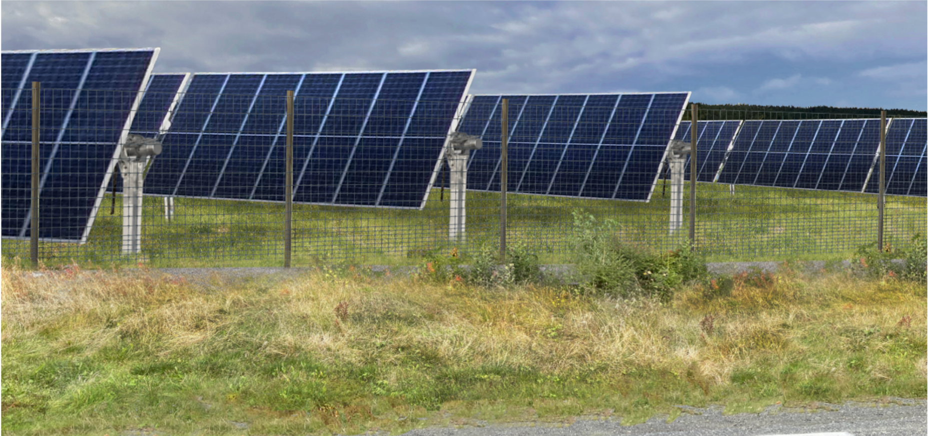
Figur 3 viser kraftverket sett på kloss hold fra fv. 33

Kraftverket sett fra fylkesvei 2388 , Borgenvegen, fotostandpunkt 3: