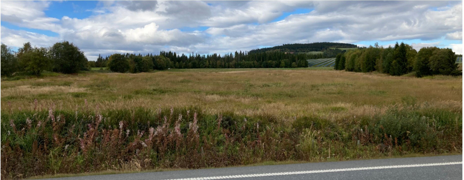
Figur 4 viser kraftverket Sett fra midlere hold nede i dalen.

Kraftverket sett fra fylkesvei 33, Fagernesvegen, fotostandpunkt 2: