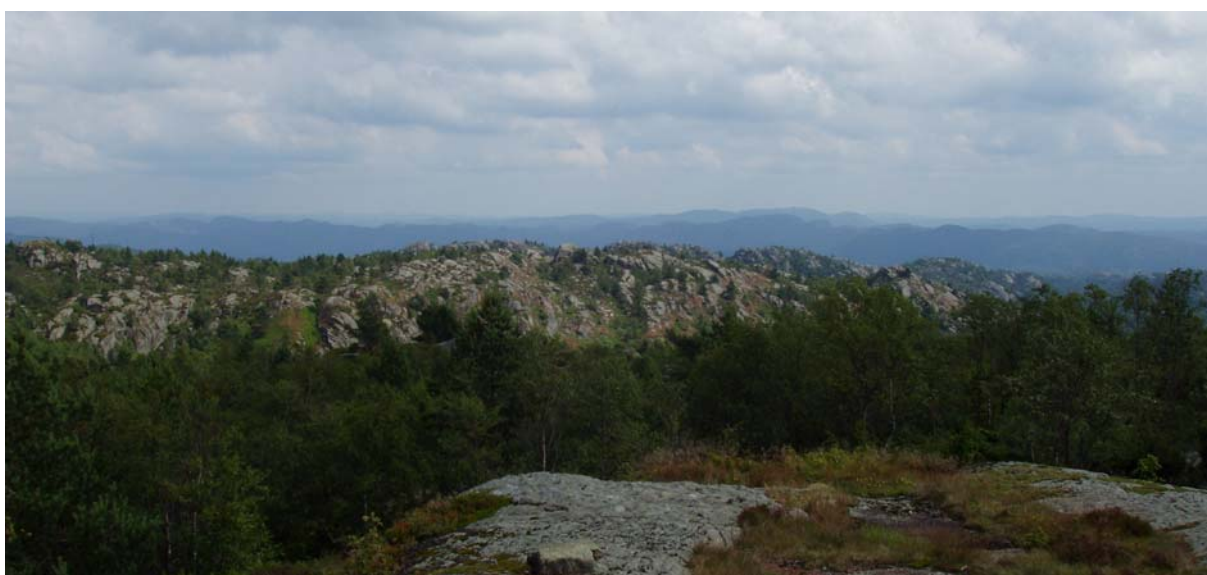
Figur 7. Deler av planområdet for Skorveheia vindpark sett fra Vardefjell.

Utredningen skal baseres på eksisterende informasjon, befaring i planområdet og erfaringer fra Norge og andre land. Lokale og regionale myndigheter og relevante interessegrupper skal kontaktes.