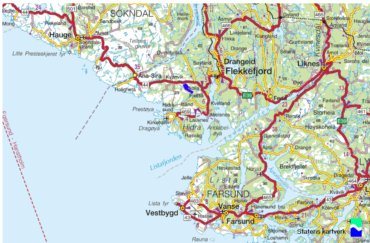
Figur 2. Lokalisering av Skorveheia vindpark markert med blått

Det er viktig at grunneierne i området er positive til prosjektet.