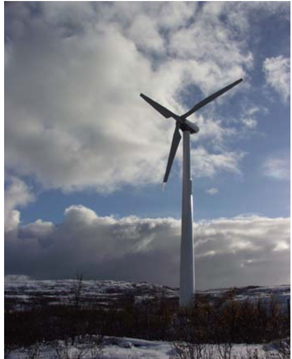
Figur 1. 200 kW vindmølle ved Murmansk.

Norsk Vind Energi er hovedaksjonær og forretningsfører for VetroEnergo AS som fokuserer på vindkraftutbygging på Kola i Russland. Høsten 2001 ble VetroEnergo sin første vindmølle reist og satt i drift på en høyde utenfor Murmansk med formål om å undersøke mulighetene for å bygge ut området i stor målestokk.