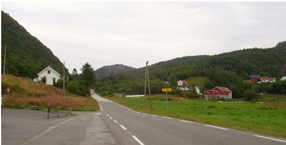
Figur 6. Kvanvik med nordvestlige deler av Skorveheia i bakgrunnen

Skorveheia vindpark kan tilføre omtrent 90 GWh med ny, fornybar energiproduksjon. Dette tilsvarer forbruket til ca. 4 500 husstander. Vindparken kan dermed anslagsvis dekke strømforbruket til nesten alle innbyggerne i Flekkefjord og Kvinesdal kommuner.