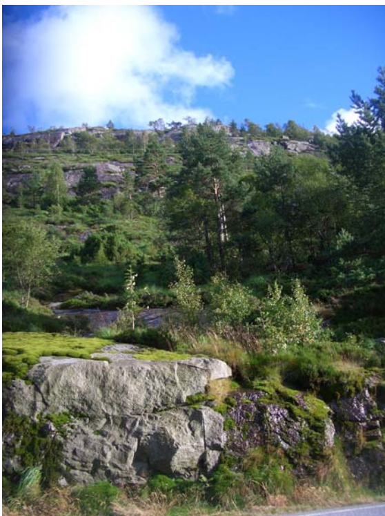
Figur 7. Fra Riksvei 44 opp mot Skorveheia

bebyggelse. Det vil også bli foretatt visualiseringer fra andre representative steder som det skulle komme ønsker om under høringen av meldingen.