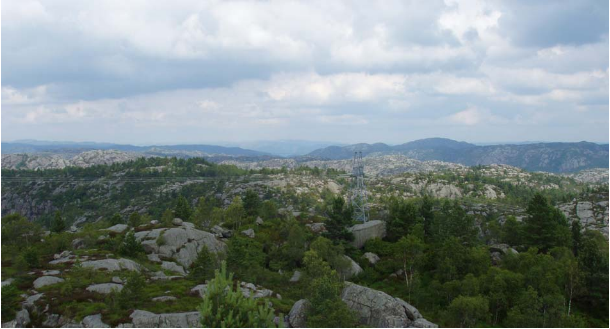
Figur 3. Deler av planområdet for Skorveheia vindpark med 300 kV høyspentlinje i forgrunnen