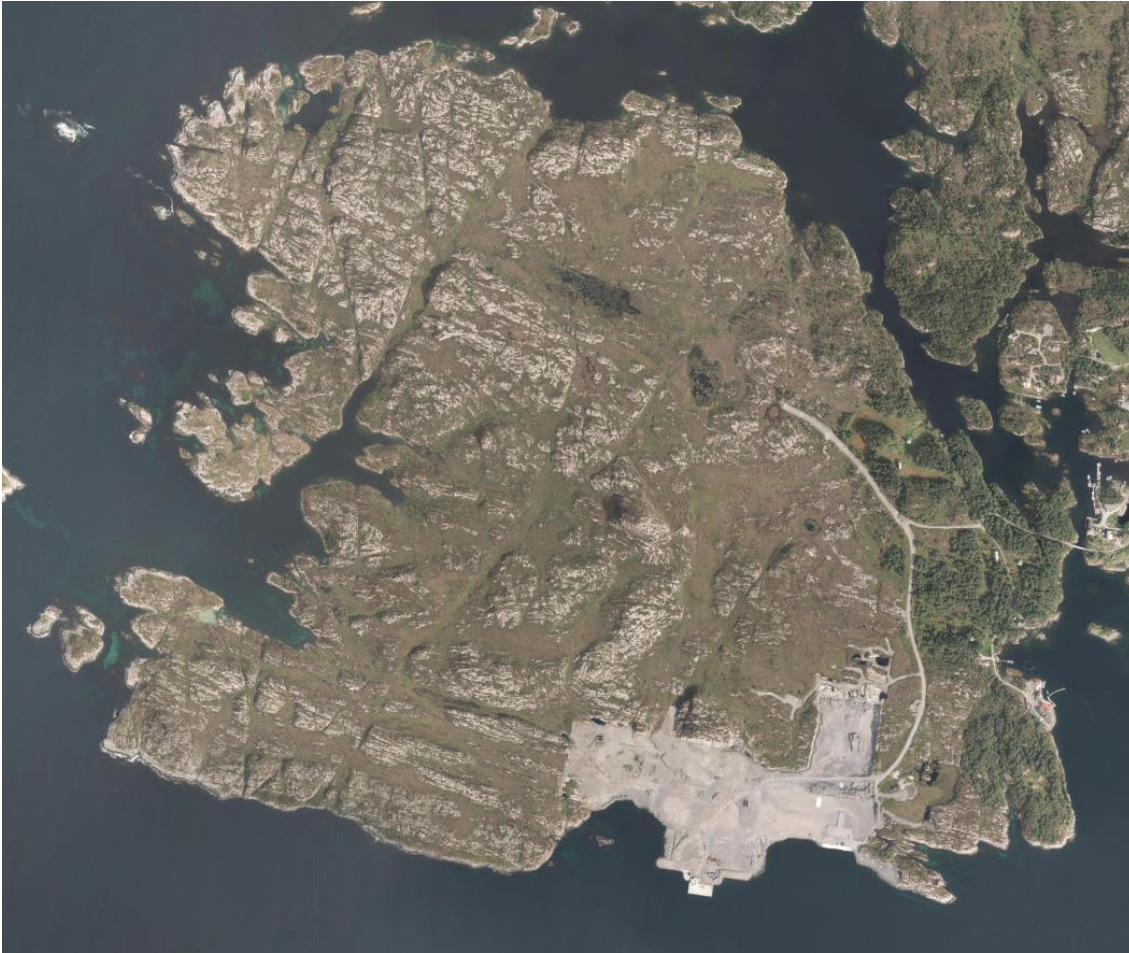
Figur 1 Flyfoto fra Lutelandet.