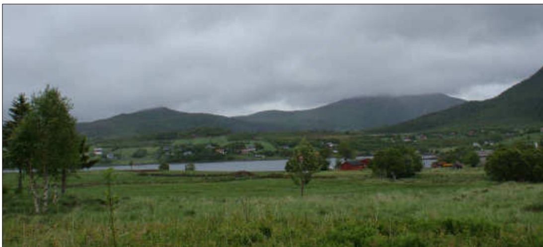
Figur 26: Lafjell og Ånstadblåheia sett fra Straumsnes i Valfjord.

Kulturmiljø Håkabogen vurderes samlet sett å ha Liten verdi .