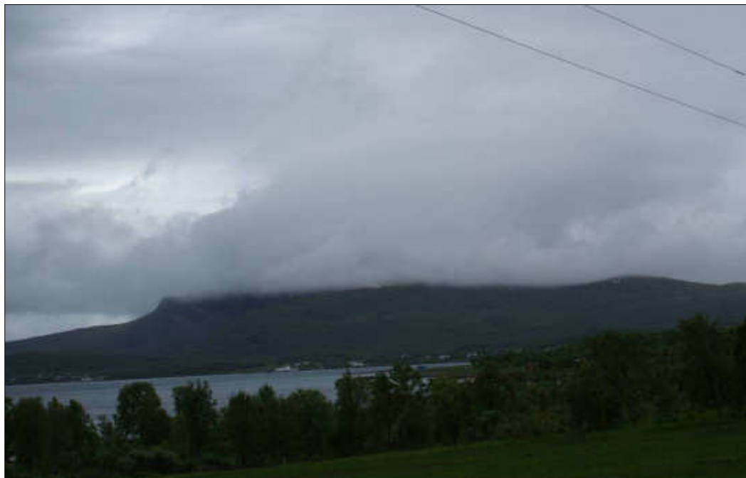
Figur 24: Ånstadblåheia sett fra Vik.

Kulturmiljø Vik vurderes samlet sett å ha middels verdi .