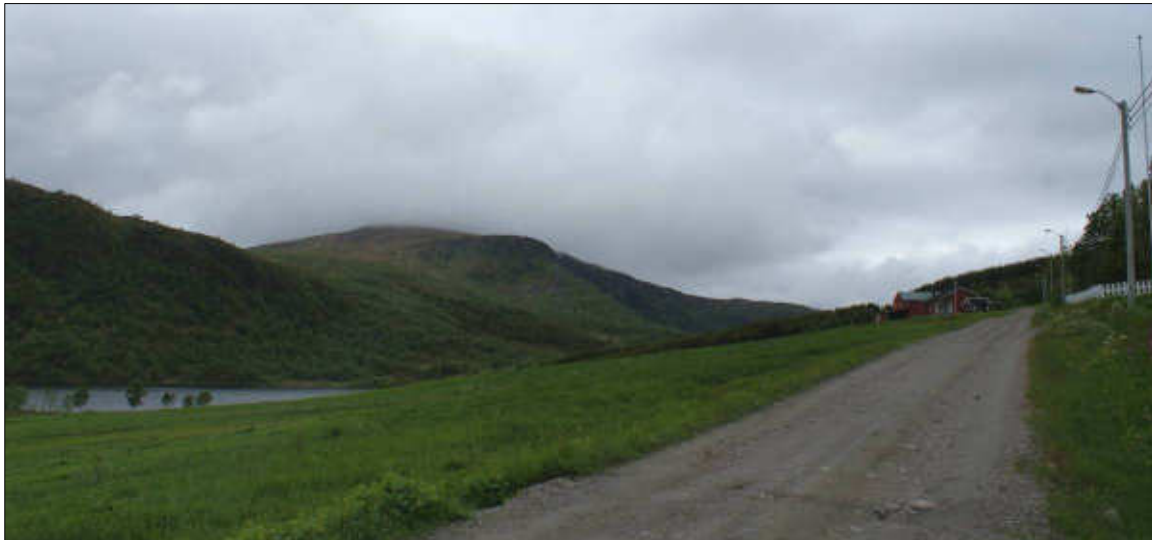
Figur 19: Utsikt vestover til Ånstadblåheia fra Ånstad. Foto: Marit Myrvoll 2010.

Kulturmiljøet Ånstad vurderes samlet sett å ha middels verdi.