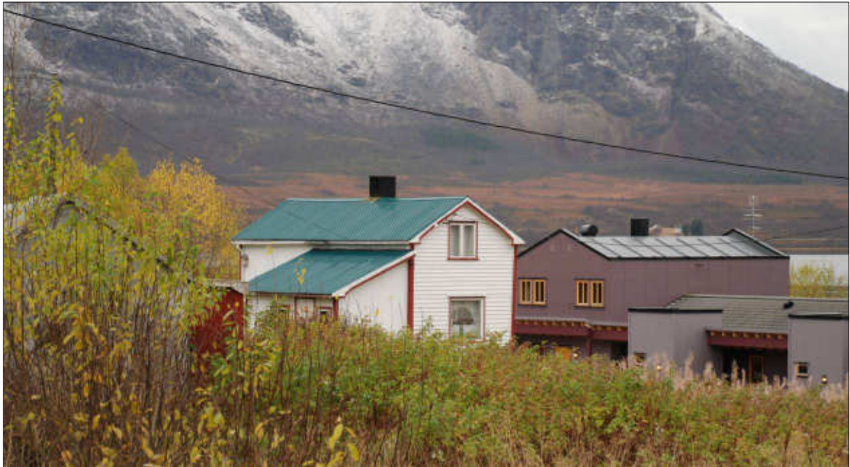
Figur 20: Sefrak-registrert bygning (Id 18700302005) med nyere bygningsmasse i bakgrunnen.

Kulturmiljøet omfatter 19 bygninger registrert i SEFRAK. Bygningene er hovedsakelig fra siste halvdel av 1800-tallet, men det er også registrert et våningshus fra 1700-tallet. Denne bygningen var imidlertid en ruin ved registreringstidspunkt. Bygningene er tilknyttet boligformål og gårdsdrift i området.