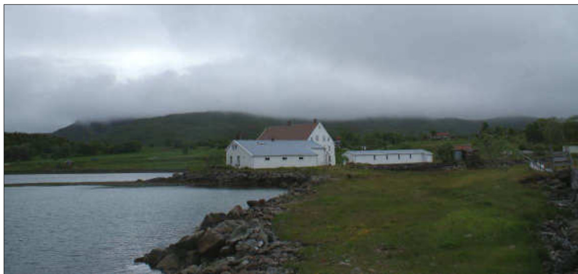
Figur 21: Jennestad handelssted med Ånstadblåheia i bakgrunnen. Ånstadblåheia er her dekket av skyer.