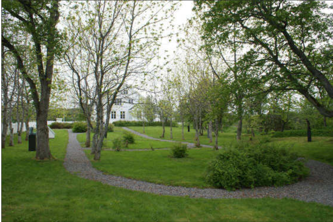
Figur 23: Skulpturhagen på Jennestad handelssted. Foto: Marit Myrvoll 2010.