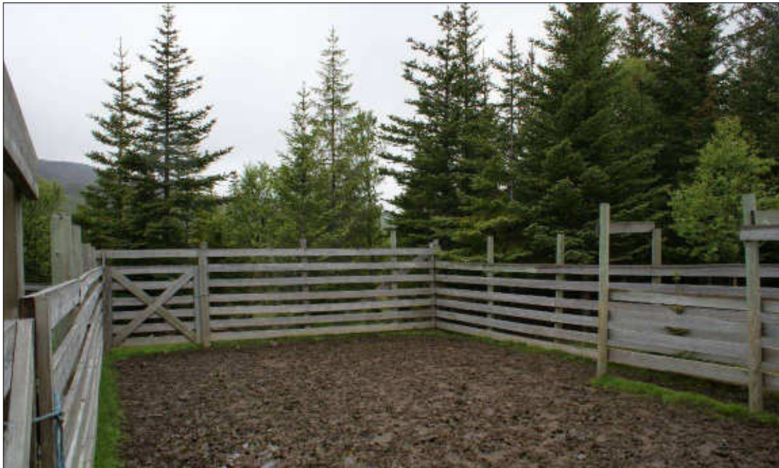
Figur 16: Reingjerdet på slakteplassen i Holmstaddalen.