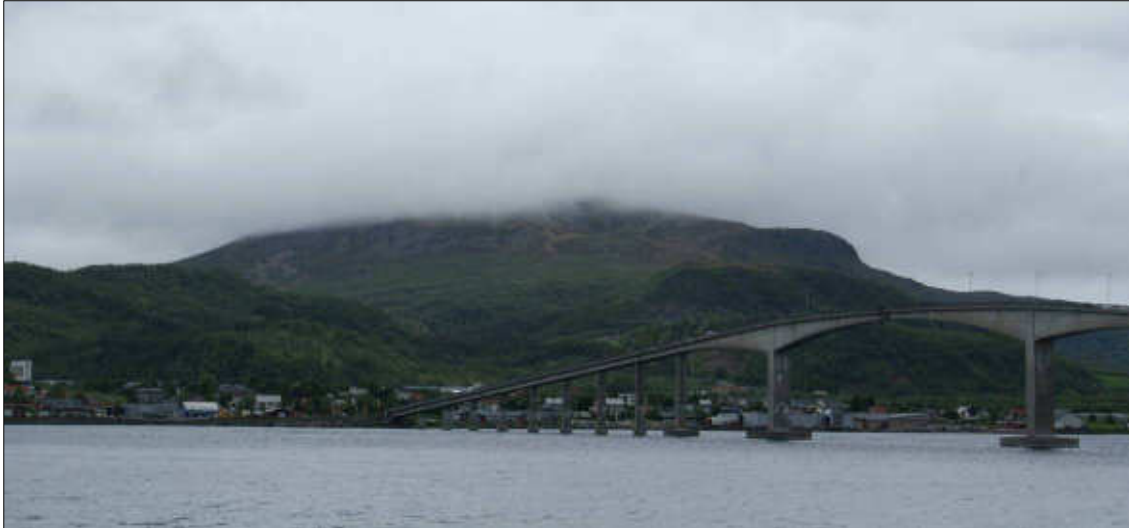
Figur 18: Ånstadblåheia sett fra Strand på østsiden av Sortlandssundet. Sortlandbrua med Sortland i forgrunnen.