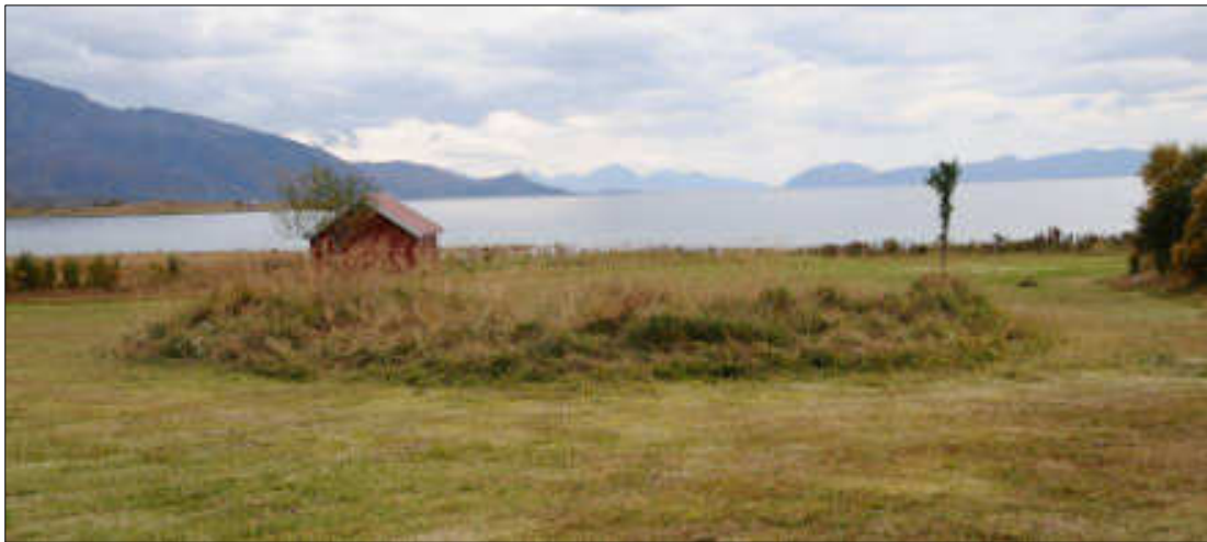
Figur 17: Gammetuft (Id 8339) på Kjerringnes i Sortland kommune. Tuften ligger i dag på en golfbane.

Kulturmiljøet omfatter også til sammen 62 bygninger registrert i SEFRAK. De fleste bygningene er fra siste halvdel av 1800-tallet, men noen er fra tidlig 1900-tall. Bygningene er for en stor del tilknyttet boligformål eller gårdsdrift i området, men her finnes også bygninger brukt som skole og butikk.