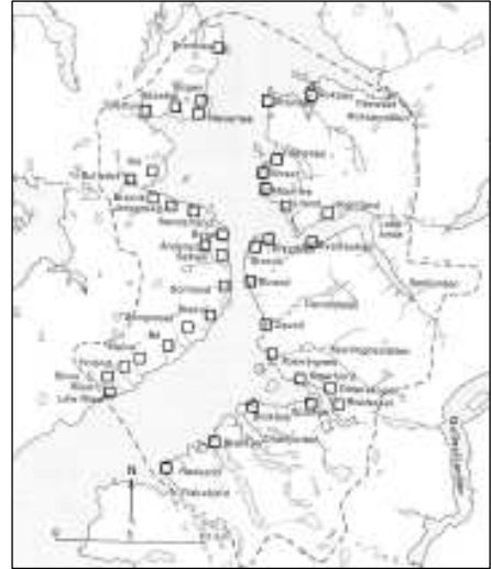
Figur 8: Gårder som trolig var bosatt i høymiddelalder, før 1350. Stiplet linje markerer Sortlands fjerding fra 1618 (Guttormsen 1990: 83).

I tilknytning til fisket, bl.a. Lofotfisket, vokste jektefarten frem. Jektefarten var en handelsfart som gikk langs kysten fra Vestlandet til Nord-Norge fra slutten av middelalderen til tidlig på 1900-tallet. Grunnlaget for jektefarten var tørrfisk, men andre ettertraktede handelsvarer var tran, hvalolje og pelsverk. I Sortland var det mange som deltok i vinterfisket, mens sommerfiske ble drevet av langt færre. Denne driftsmåten er typisk for det nordnorske fiskerbondehusholdet. Om sommeren, da høyonn og andre sesongvise tyngre jordbruksaktiviteter måtte gjennomføres, var husbonden hjemme på gården. Om vinteren drev han fiske. På tross av at gårdene i Sortland var ansett å ha en ugunstig lokalisering i forhold til fiske, var deltakelsen i vinterfisket høy.