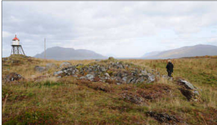
Figur 7: Gravrøys (Id 67674) på Stamnes i Sortland kommune.

I denne perioden (siste årtusen f.Kr.) skjer det en differensiering i etnisitet med hensyn til samisk og norrøn befolkning i Norge. Den norrøne jernalderbefolkningen oppfattes tradisjonelt som bofaste jordbrukere organisert i såkalte høvdingdømmer hvor overhodet var den politiske, militære og åndelige leder. Gravhauger og gravrøyser er, sammen med langhus, åkerreiner og rydningsrøyser ansett som gode indikasjoner på gårdsbosetning i jernalder. Sammenliknet med mange andre regioner i Nord-Norge, er det mange spor etter førkristen tid i Sortland. Det er rike og omfattende spor etter norrøn gårdsbosetting, eksempelvis i gode jordbruksområder hvor dagens matrikelgårder og bebyggelse langs strandsonen finnes. Den vanligste kulturminnetypen i dette er gravhauger og gravrøyser. Slike graver kan inneholde gjenstander som knivblad, perler, vevskje, hårspyd, hårnål og kam av kvalbein, leirkar, vevsverd. I Sortland kjenner en til totalt 270 graver fra førkristen tid om man tar med alle bevarte gravhauger og de som ble ødelagt etter 1870-tallet. Gravlegging i haug ble forbudt etter kristendommens innføring i Norge på 1000-tallet.