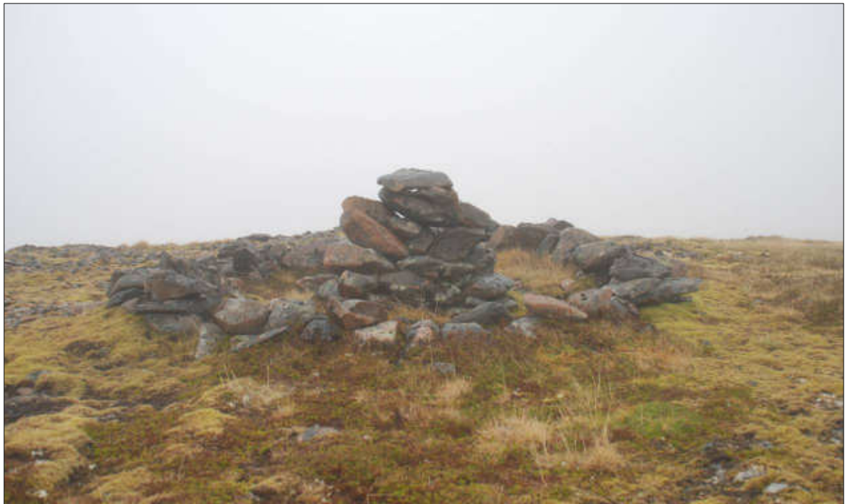
Figur 15: Steinring med varde (Id 136739) på Ånstadblåheia.