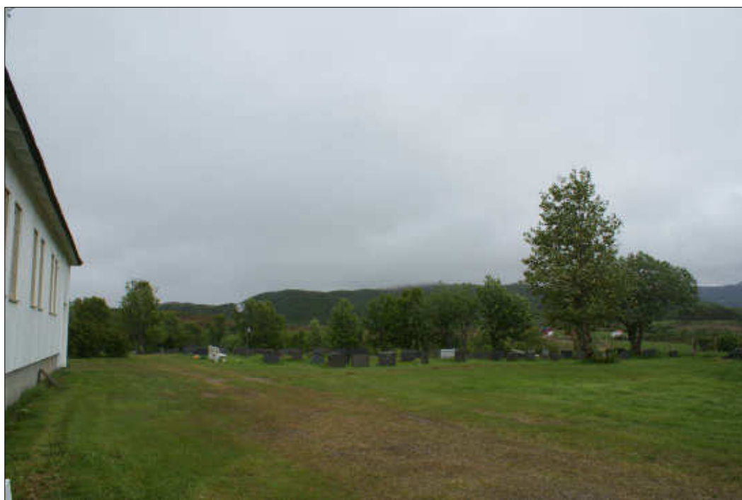
Figur 25: Lafjell sett fra Indre Eidsfjord kirke. Foto: Marit Myrvoll 2010.