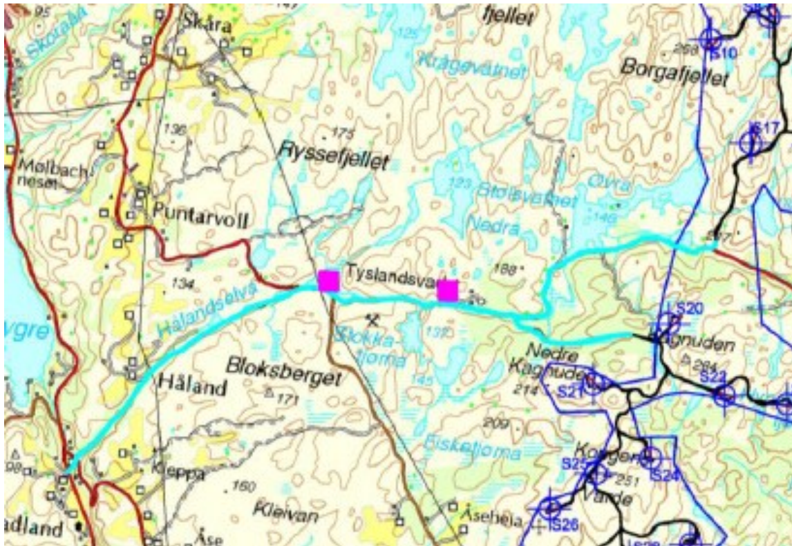
Figur 2. Kart over oppgradering av eksisterende veier (turkis farge) og mellomlagrings-/riggplasser (rosa farge)