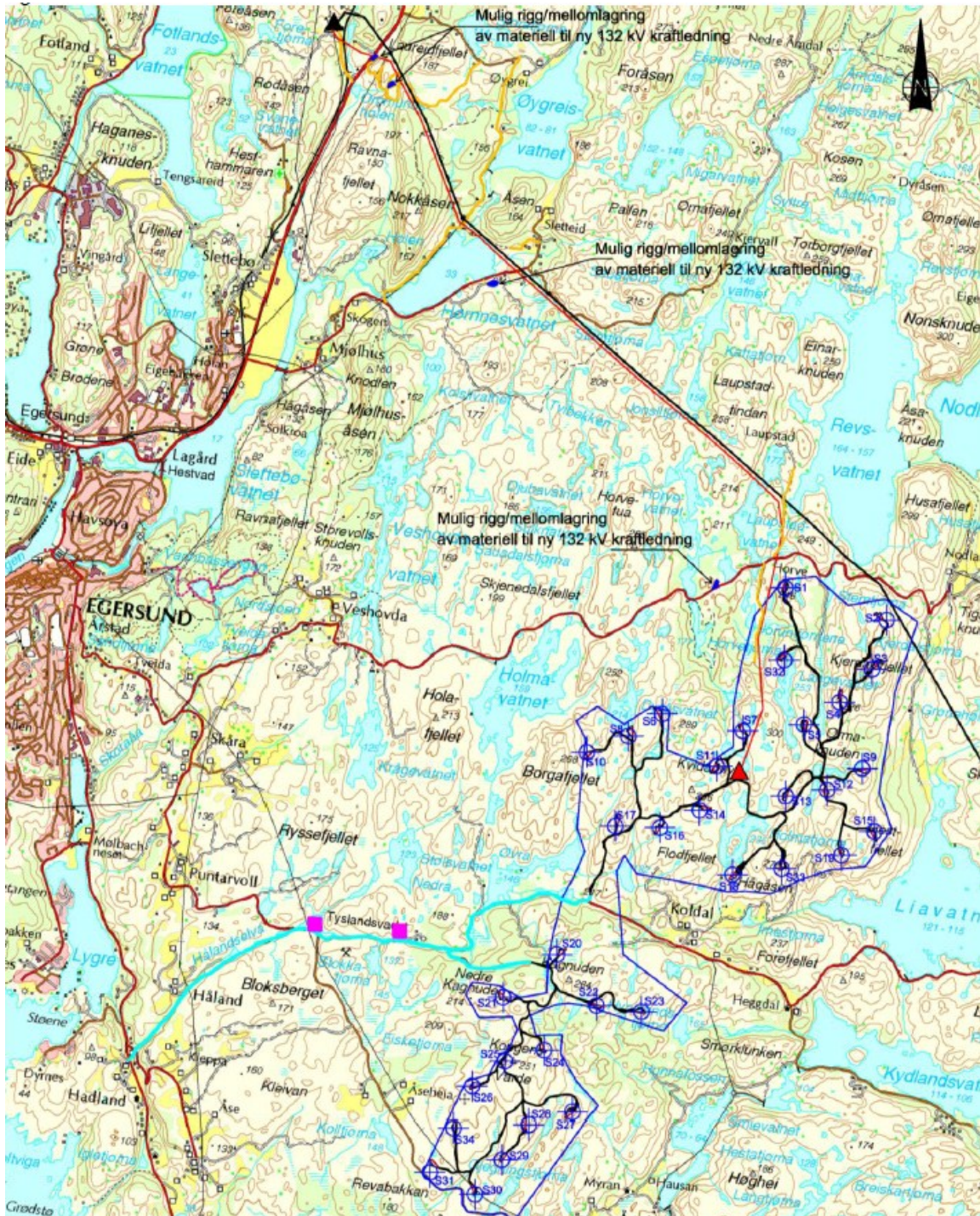
Figur 1. Planlagte tiltak ved Egersund vindkraftverk

Tiltakene det søkes om er kartfestet i figur 1.