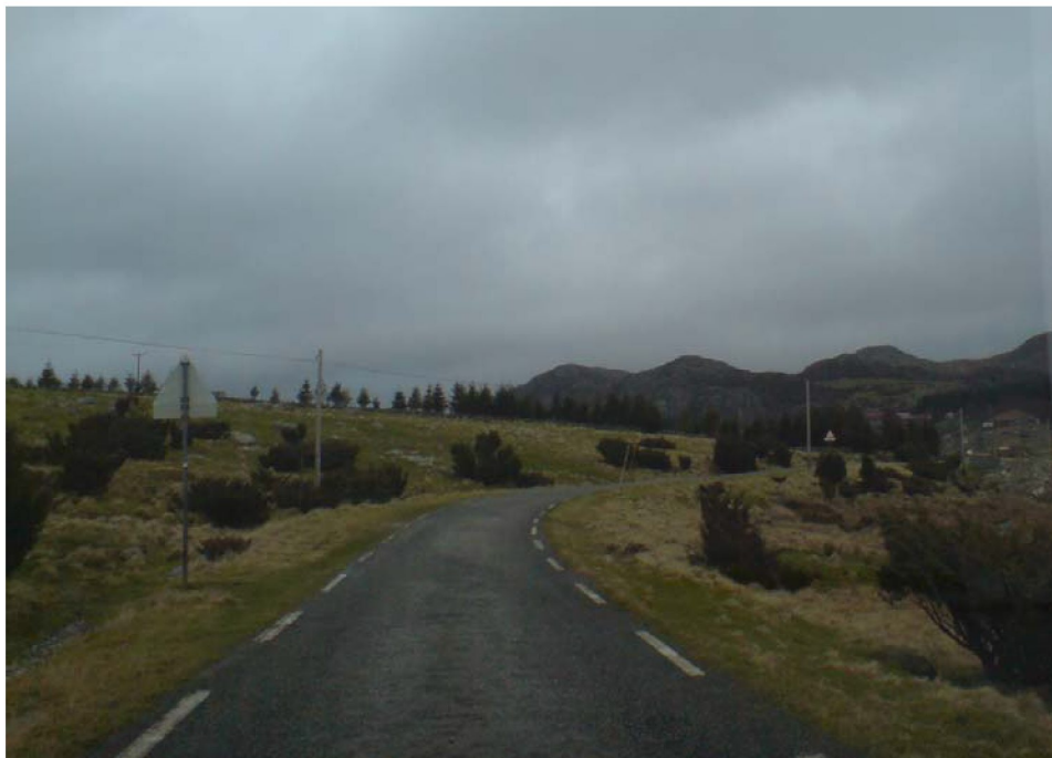
Figur -5: Eksisterende kommunal vei i Krogedalen

Den kommunale veien i Krogedal må oppgraderes.