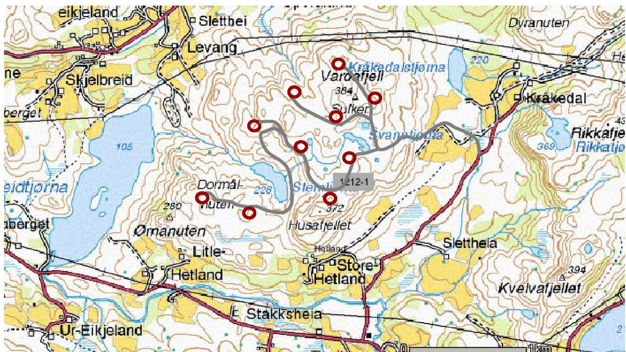
Figur -3: Mulig plassering av vindturbiner i terrenget

Mulig plassering av vindturbiner med anleggsvei er vist på kartskissen nedenfor. Endelig plassering og valg av størrelse og antall vindturbiner vil bli gjort når vindkart over området er ferdig.