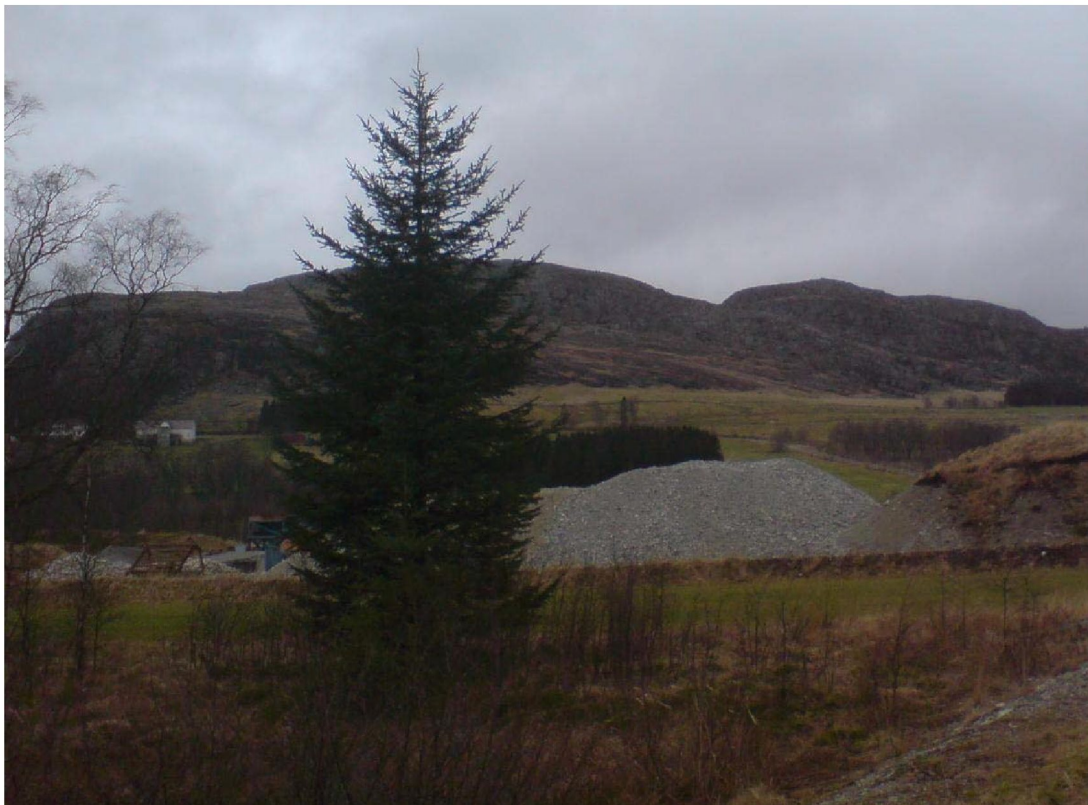
Figur -4: Vardafjellet/Dormålnuten sett fra syd

Nærheten til E39 gjør at man har en rekke alternative valgmuligheter når det gjelder å føre frem utstyret.