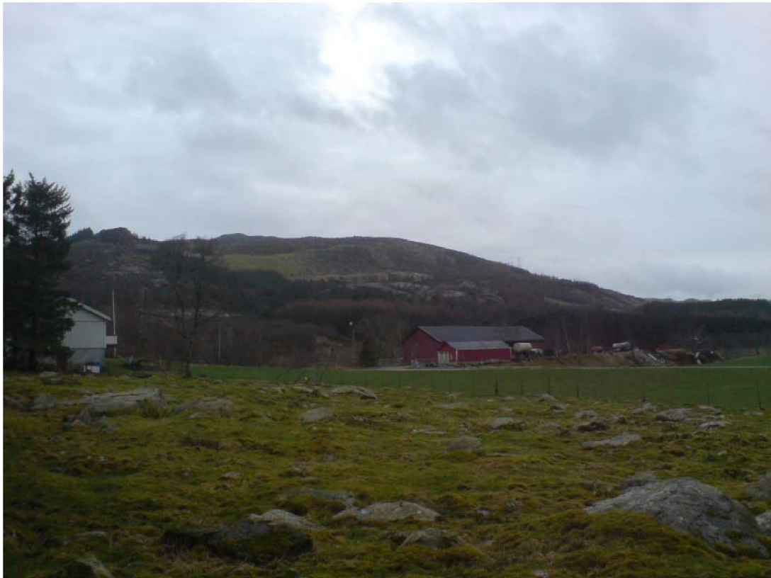
Figur -1: Vardafjellet sett fra nordøst