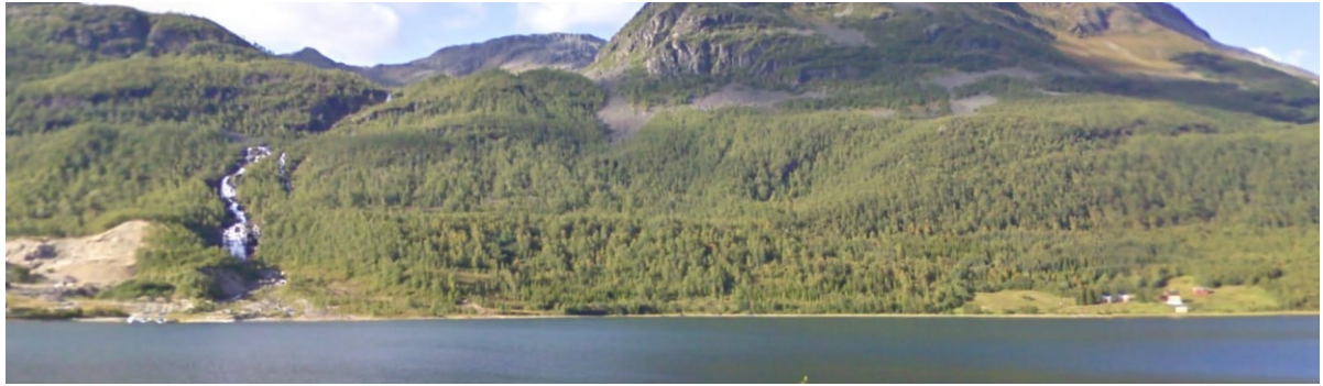
Oversiktsbilde Turrelva, med fossen, til venstre. Tunet med samiske kulturminner til høyre i bildet. Rørgate og anleggsveg tenkes anlagt noe nærmere elva enn tunet. Til venstre ses også deler av et stort massetak, jfr. reguleringsplan.

Midlertidig veg med tilbakeføring av terreng og revegetering tilsier at over tid vil inngrepet utbyggingen medfører, bli mindre markant. Men det vil ta lang tid.