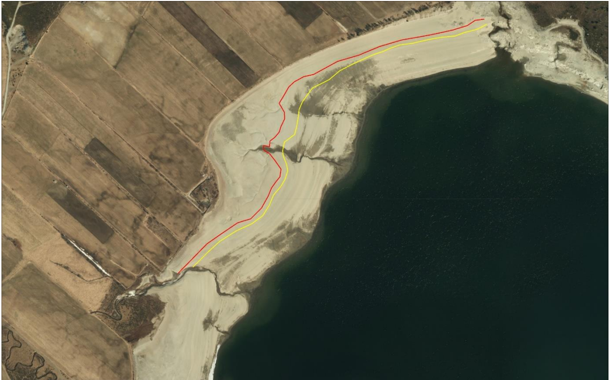
Figur 5.5 Reguleringssonen i nordenden av Tessemagasinet. Gul linje angir midlere vannstand per 1. juli ved gammelt reglement og rød linje vannstand per 1. juli med ny fyllingsbestemmelse.

I mikroperspektiv vil det visuelle inntrykket reguleringssonen gir som landskapselement, være mer dominerende. Spesielt ved utløpene av de største tilløpselvene hvor det har bygd seg opp elvedeltaer ut i magasinet (figur 5.5). Perioden rundt 1. juli vil imidlertid ha svært rask stigning i magasin vannstanden, og i normalår vil en forskyvning i dato for fyllingsbestemmelsen med inntil 10 dager, heller ikke medføre nevneverdig forverring i landskapsopplevelsen i dette perspektivet.