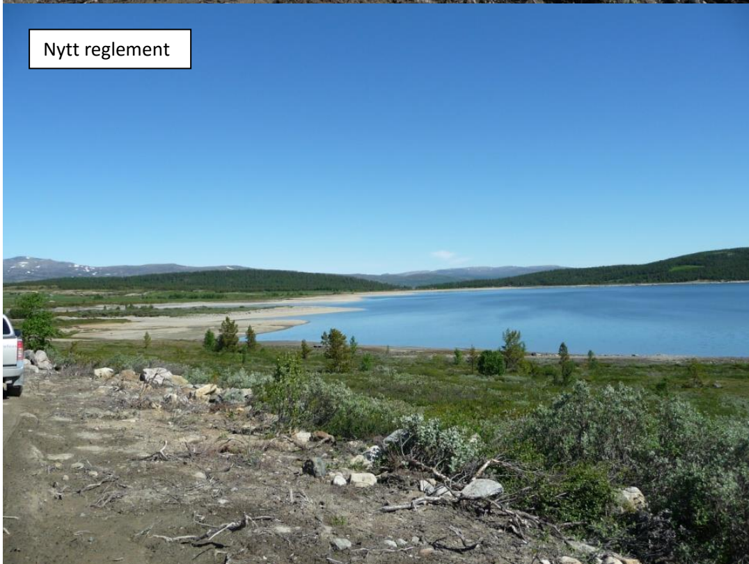
Figur 5.4 Tøssemagasinet (Tverrlandet nord) ved vannstand på hhv kote 850,13 (tilnærmet normal fylling per 1. juli ved gammelt reglement) og kote 850,85 (tilnærmet lik kote for fylling per 1. juli med ny fyllingsbestemmelse)