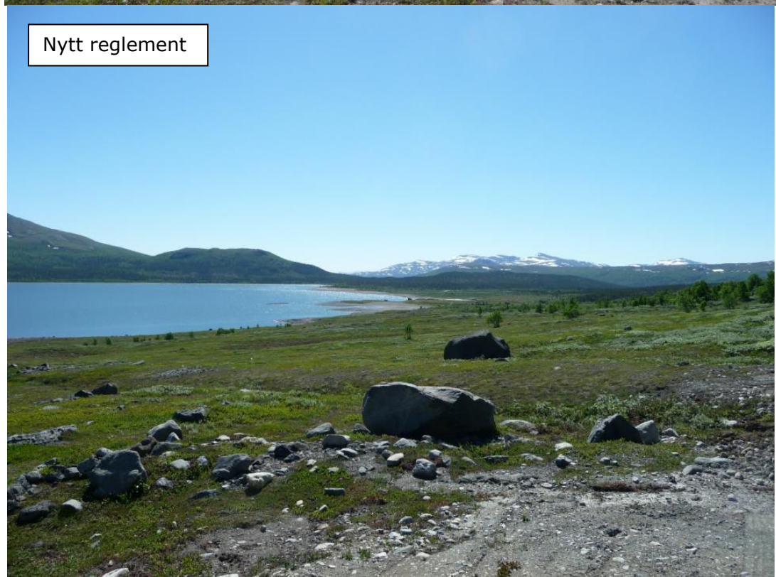
Figur 5.3 Tessemagasinet (Kyrkjeflaten sør) ved vannstand på hhv kote 850,13 (tilnærmet normal fylling per 1. juli ved gammelt reglement) og kote 850,85 (tilnærmet lik kote for fylling per 1. juli med ny fyllingsbestemmelse)