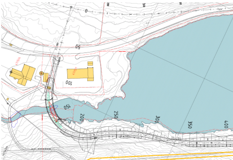
Kartet viser den påklagede veitraseen.

Som bildene viser er trasene mellom bensinstasjonen og butikken like og NVE mener trafikbelastningen på denne strekningen vil være den samme uavhengig av hvilken side av vannet veien går videre. Den regulerte veiens videre trasé mener NVE i større grad beslaglegger arealer ved Haugsværvatnet og gir større trafikbelastning nær bebyggelsen enn den påklagede traséen. NVE kan derfor ikke se at påklaget vei legger mindre begrensninger for utviklingen av Haugsværvatnet enn den regulert veien.