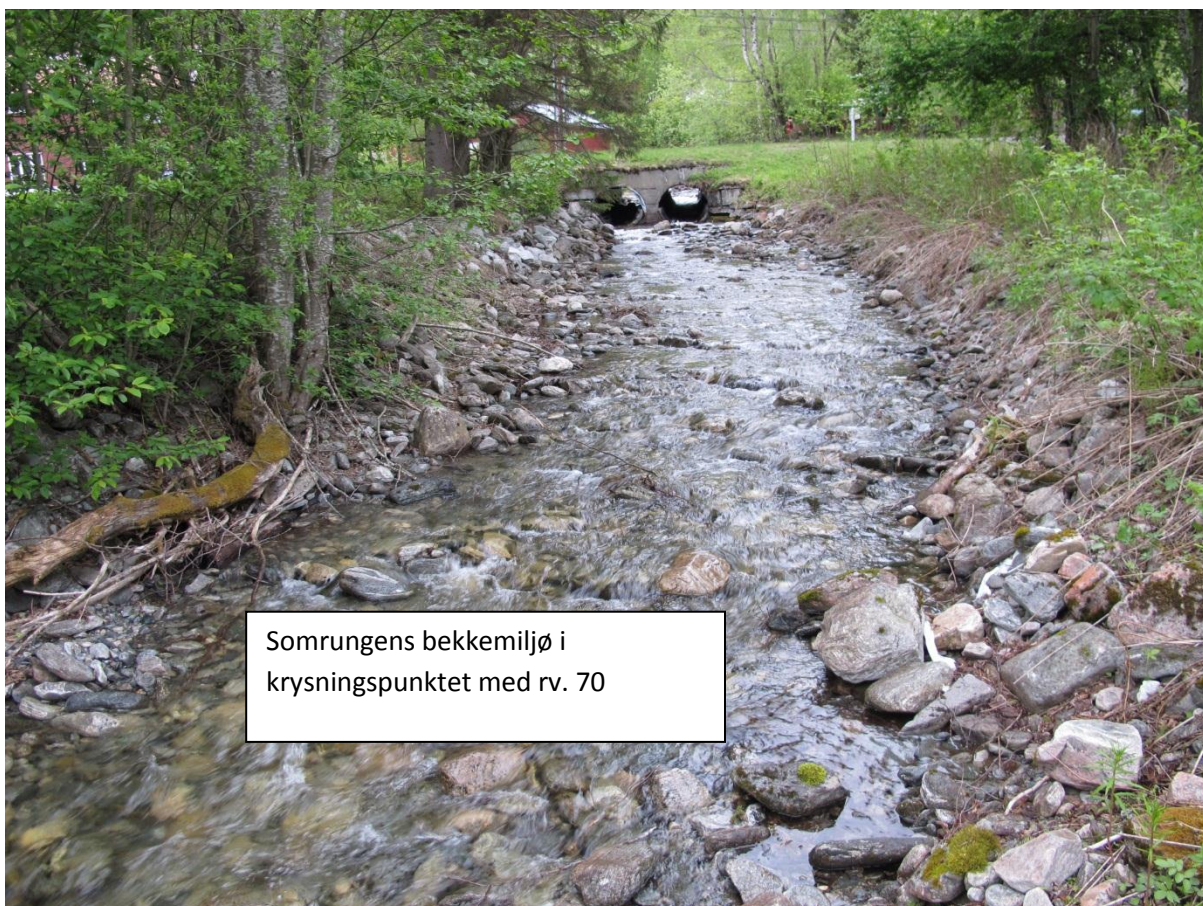
Somrungs bekkemiljø i krysningspunktet med rv. 70