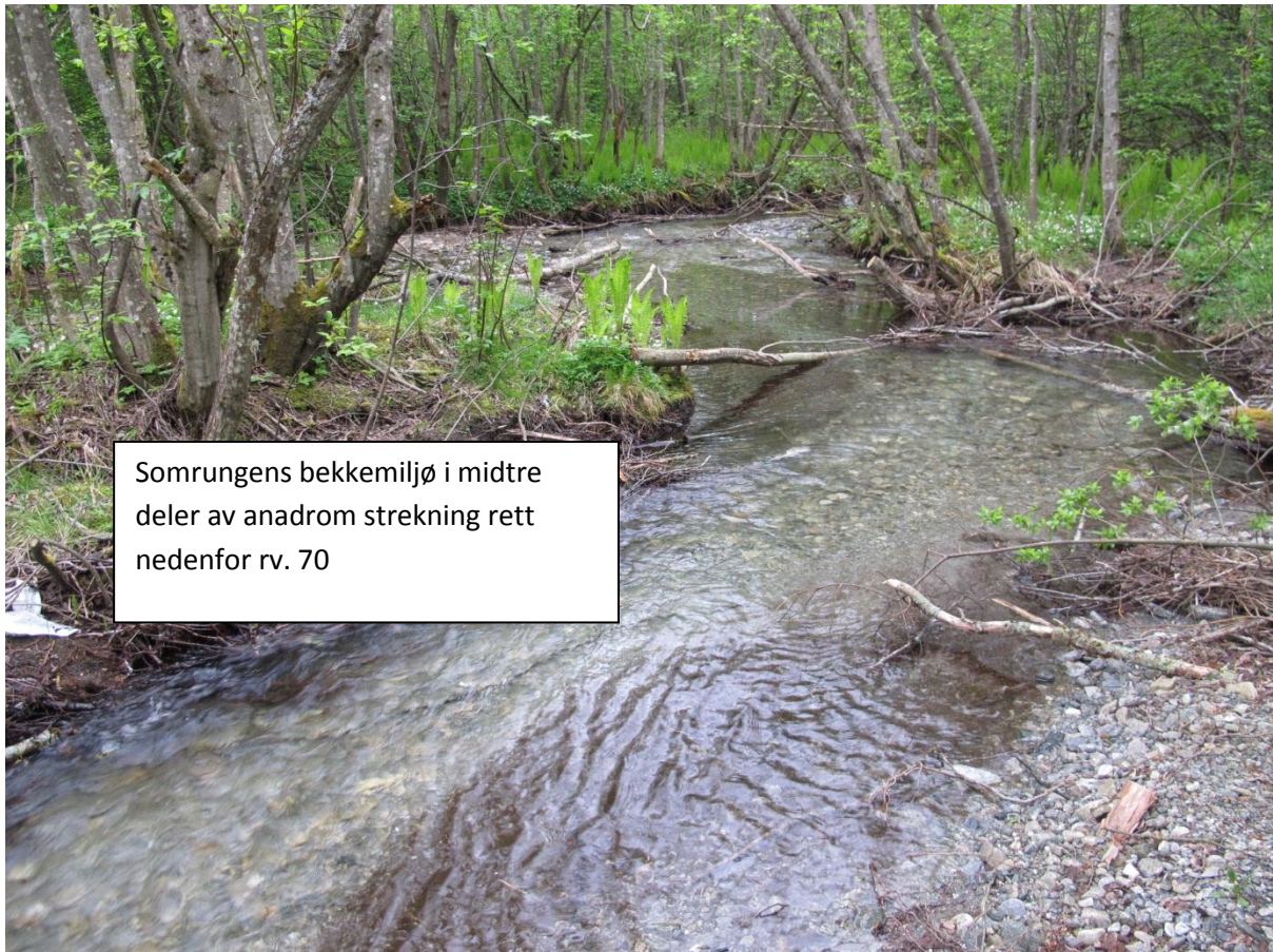
Somrungs bekkemiljø i midtre deler av anadrom strekning rett nedenfor rv. 70