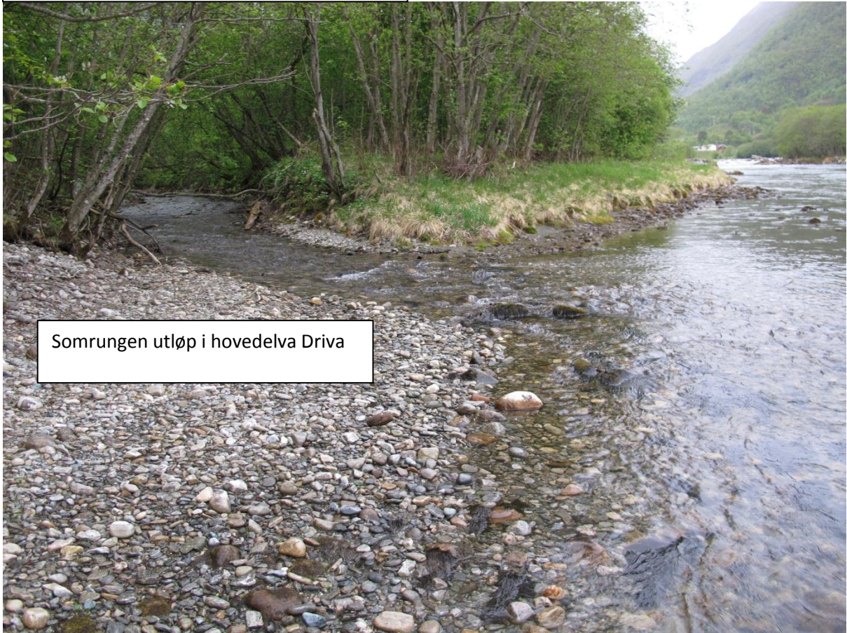
Somrungen utløp i hovedelva Driva