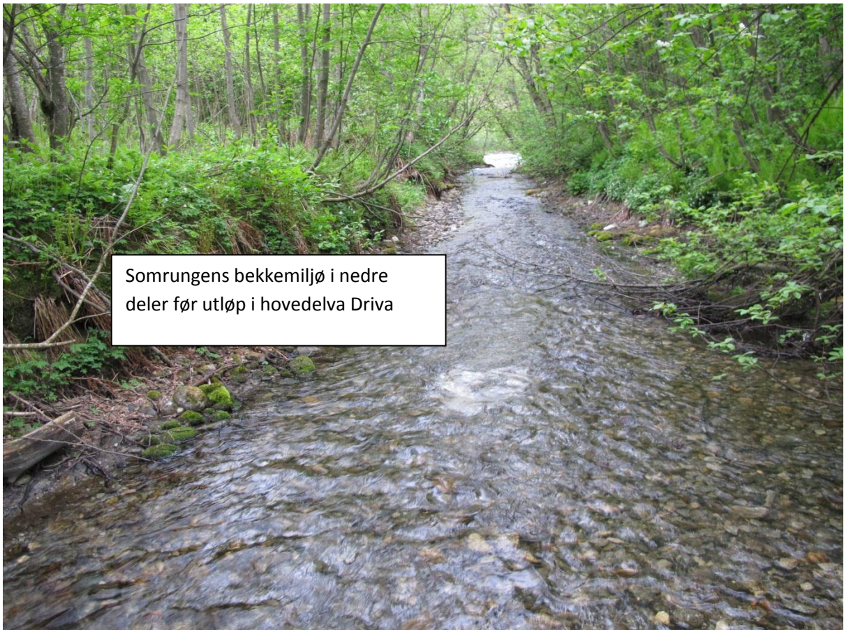
Somrungenes bekkemiljø i nedre deler før utløp i hovedelva Driva