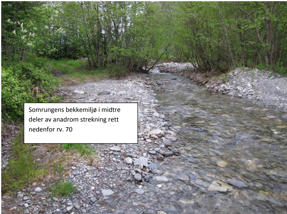
Somrungs bekkemiljø i midtre deler av anadrom strekning rett nedenfor rv. 70