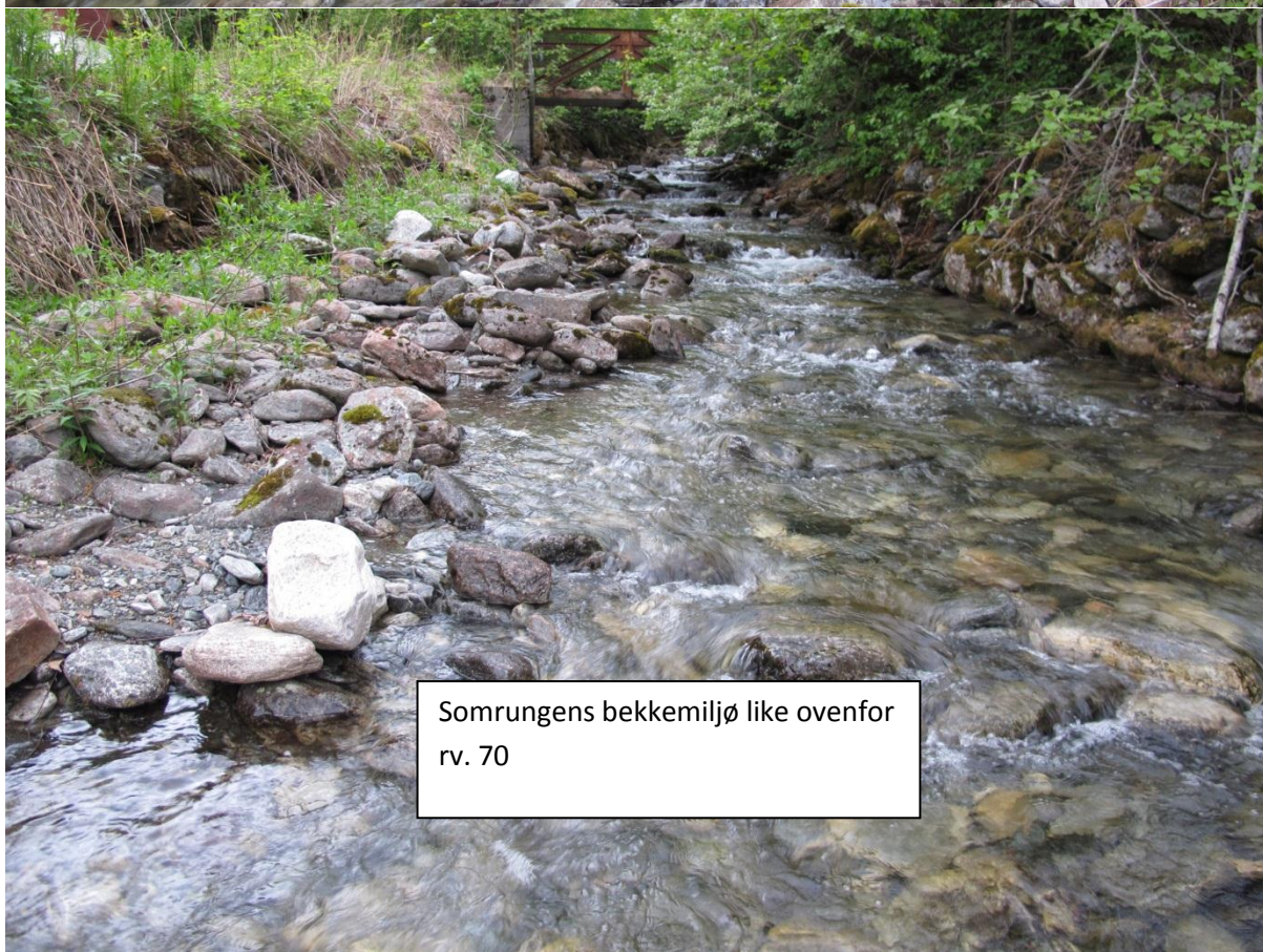
Somrungs bekkemiljø like ovenfor rv. 70