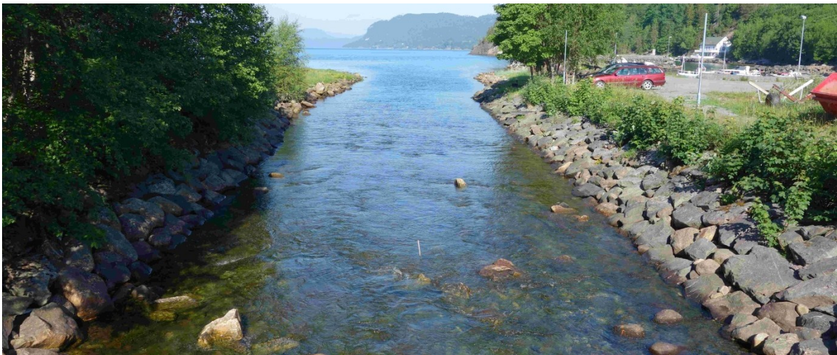
Figur 3. Biletet viser Vaksvikelva der denne renn ut i sjøen. Som ein ser er den retta ut og forbygd i dette området.