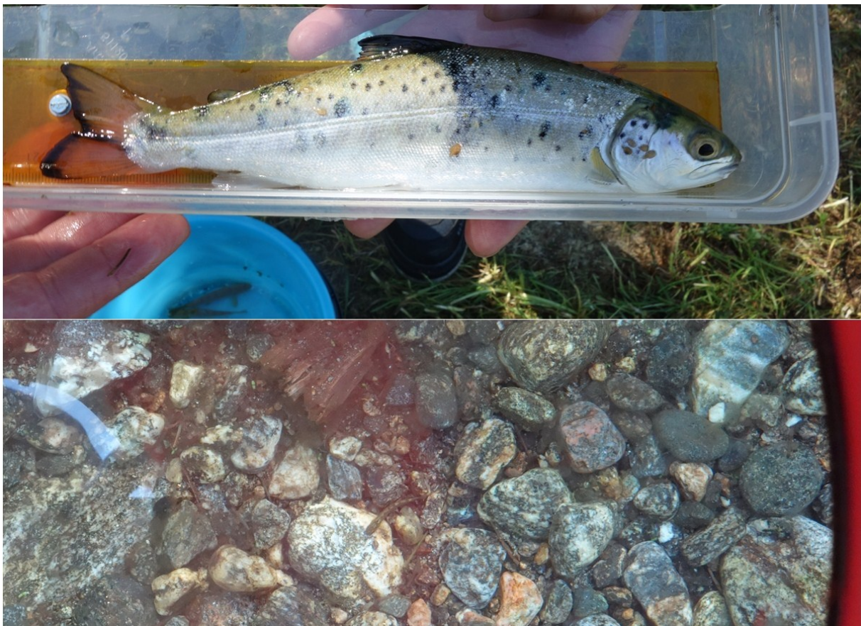
Figur 6. Biletet øvst viser sjøauren som vart fanga ved undersøkinga, og nedst gytesubstrat litt ovanfor det avfiska området. Som ein ser er dette svært godt. Midt i biletet står det ein ársyngel, estimert til 2,5-3 cm.

mengdene fisk her ut frå undersøkinga vår. Vi verken fanga eller såg ål, og kan difor ikkje seie noko om denne arten ut i frå denne undersøkinga, men vi såg at elva var flat og fin nedst med mykje mose i og rundt elveløpet. I og med at det ligg eit vatn i vassdraget om lag 350 moh, kan det likevel vera at det finst ål i elva og i det nemnde vatnet. I dei nedre delane der elva er forbygd, er det fine skjulmoglegheiter for ål mellom storsteinane langs kantane. Slik vi ser det, er dette prosjektet planlagt slik at det tek vare på heile den delen av anadrom strekning som ein reknar som viktig som gyte- og oppvekstområde for anadrom fisk. Usikkerheita i undersøkingane ligg i om ål nyttar elva, men i og med at inntaket er planlagt med coandarister, ser vi også dette som relativt uproblematisk.