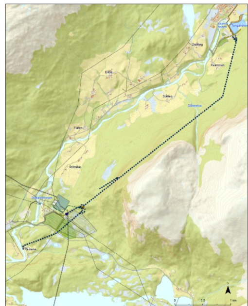
Sunnfjord Energi As