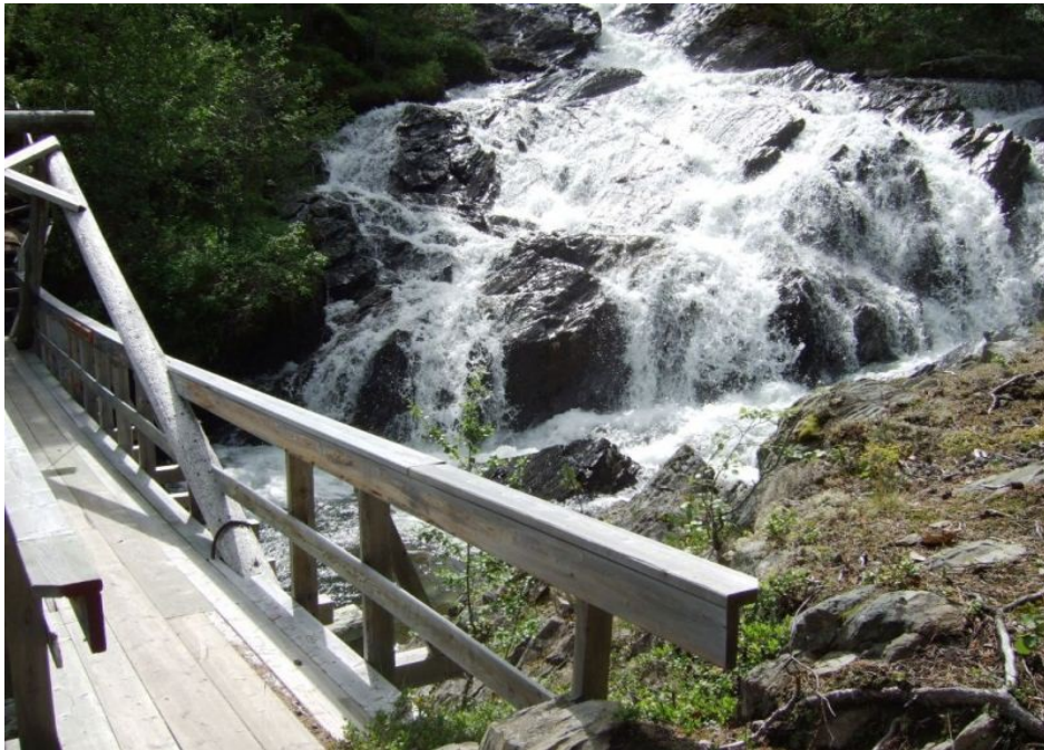
Fossen ovafor brua på Nedre Floten.

Kvernåe viser seg ved brua på to ulike måtar, som ein lang foss ovafor brua og som ein serie fossefall med høljar eit lite stykke nedafor brua. Det er fisk i hølane, men fisket er no til dags lite brukt. Om vinteren blir det ofte ope vatn i desse hølane.