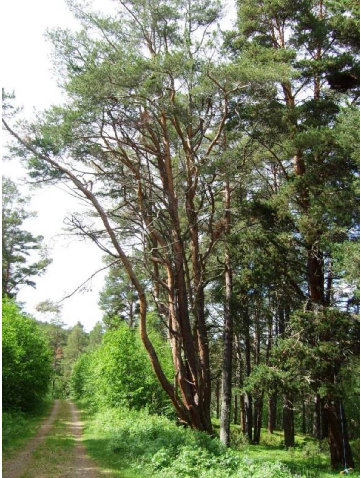
«Bilveg» om det kan kallast så på sørsida av Kvernåe og Fjellvabekken.

For folk som kjem utanfrå til Kvernåe, startar ofte turen på bilvegen sør for Kvernåe (med nord og sør vil eg her meine opp dalen og ned dalen slik innarbeidd seiemåte er i Gudbrandsdalen). Bilvegen kjem opp til Nedre Floten frå sør som på den sida av åa også blir kalla Milisletten. Dette er ein del av den gamle strandlina til ein isdemd sjø som vart til i nedsmeltings-perioden etter siste istida.