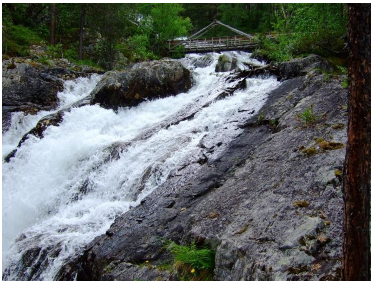
2. juli 2007