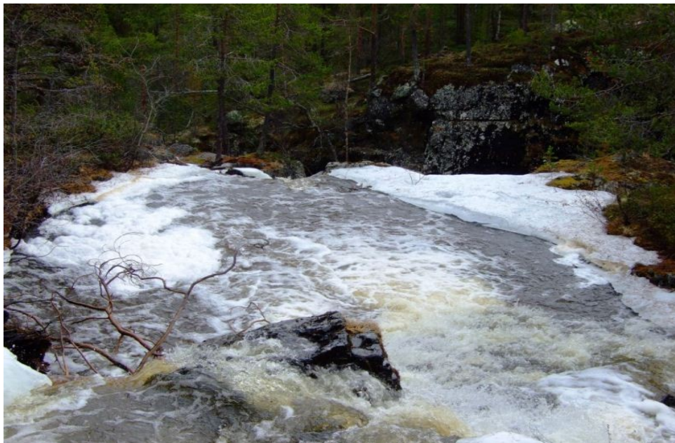
Kvernåe ved brua på Nedre Floten.

Vatnet har passert under brua på veg ned mot neste foss som er starten på ein serie med karakteristiske fossefall. Dei øvste er lette å observere frå svaberga ved brua. Fotoet er teke frå brua.