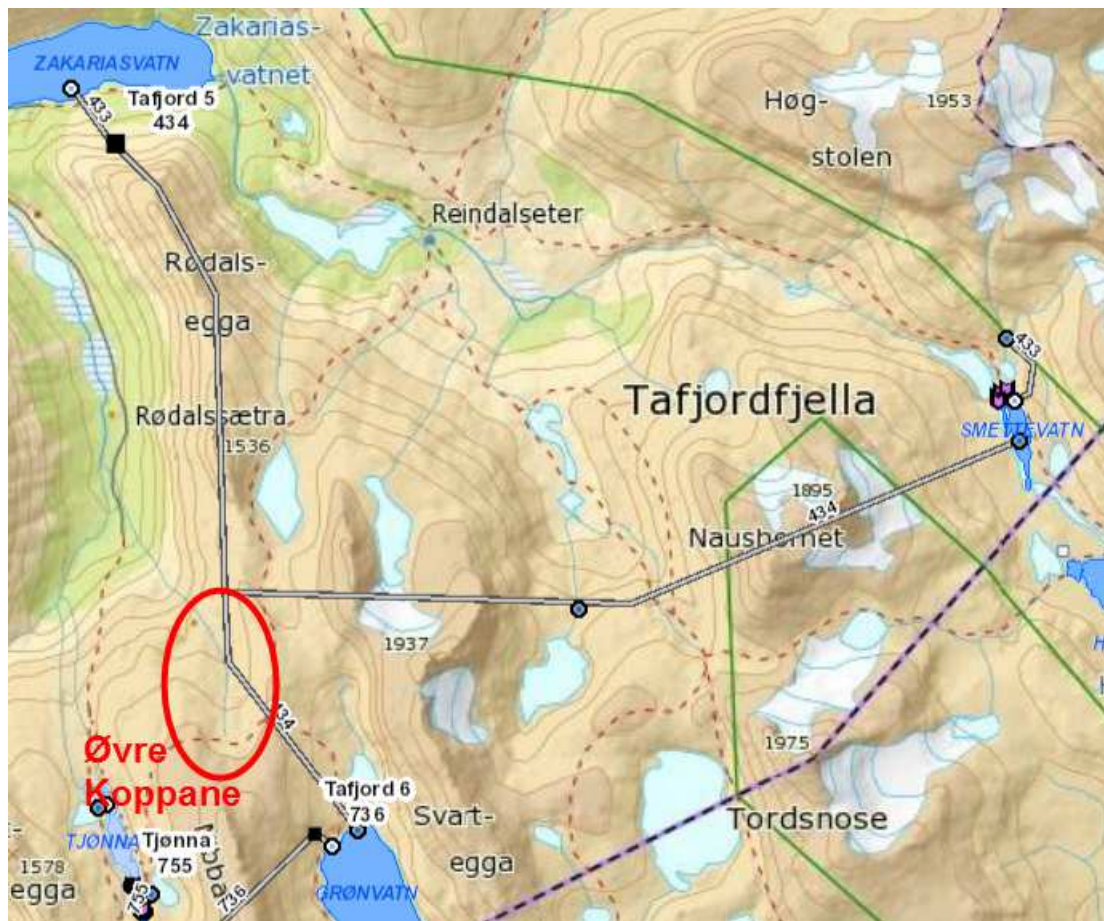
Figur 3 Driftvassveg til Tafjord 5, med greiner frå Smettevatn og Brusebotnvatn (Grønvatn).