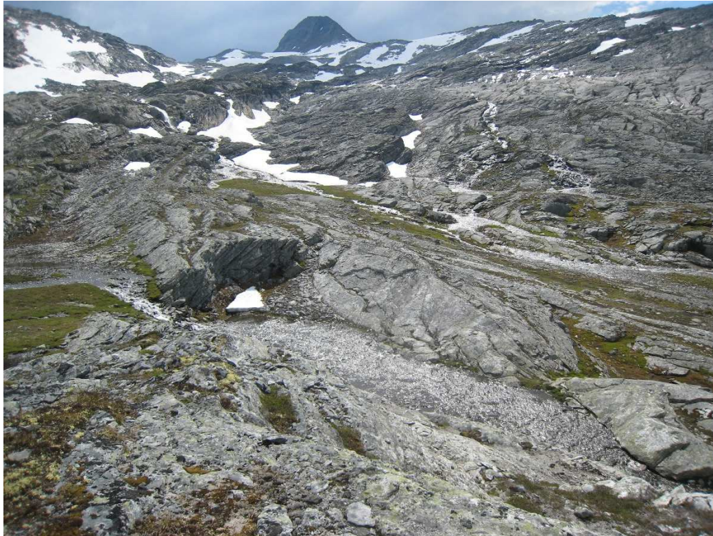
Figur 2 Terreget i Øvre Koppane med snaufjell og tynt vegetasjonsdekke i søkk i terrenget.

I nordenden av nedbørsfeltet er det eit tjern. Dette ser ein heilt nord på oversiktskartet som viser nedbørsfeltet i Øvre Koppane i vedlegg 1.