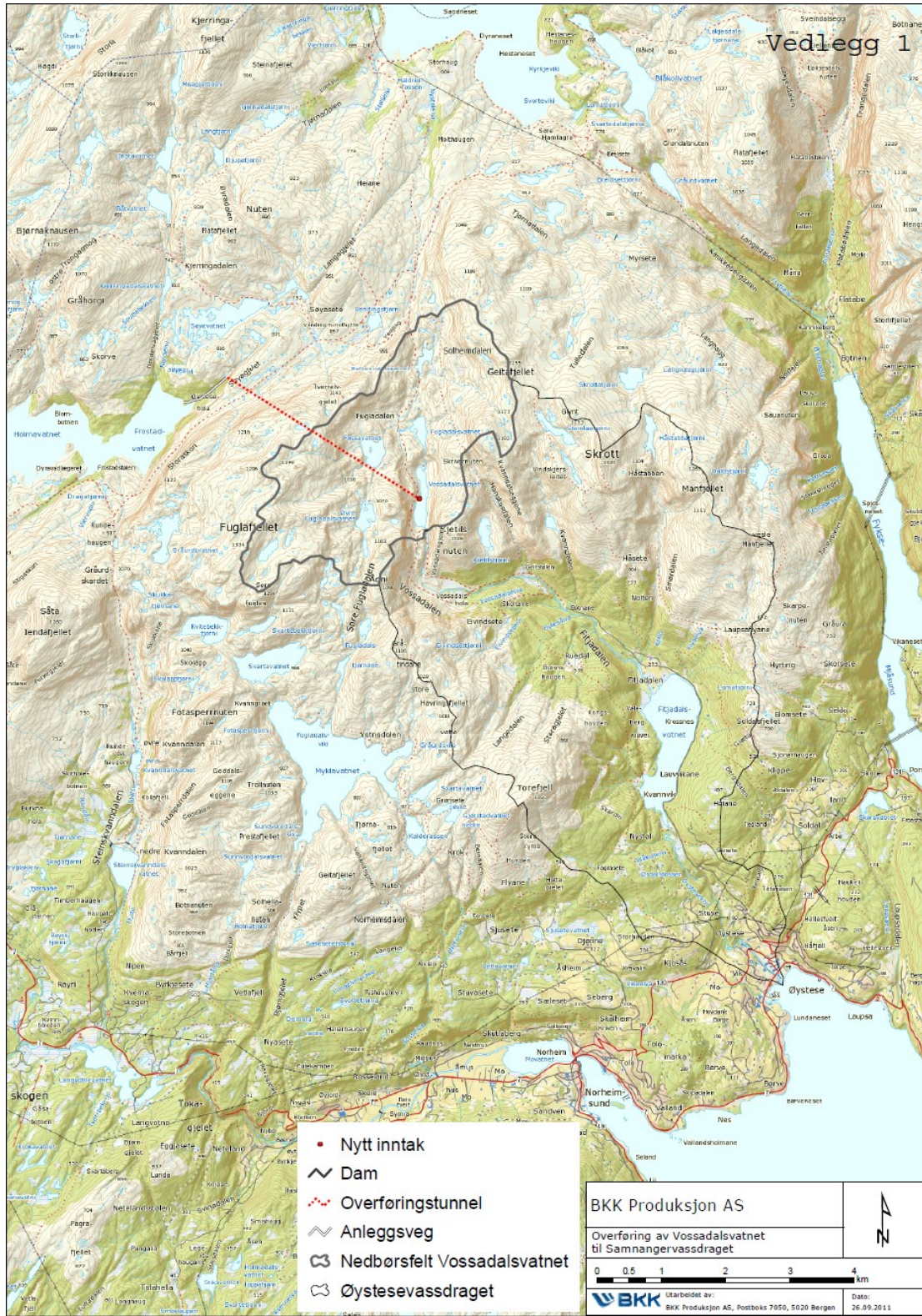
Figur 1: Kart over tiltaksområdet og nedbørsfelt for overføringen fra Vossadalsvatn til Svartavatn.