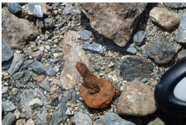
Mogleg båtnagle.

Ca. 30 meter nedanfor tufta, ved eit bekkeløp som kjem fram ved låg vasstand, vart det påvist ei mengd gjenstandar rundt i grusen. Dei fleste gjenstandane var ubestemmelege rustklumpar, men nokre og heilt tydeleg spikarar, hesteskosaumar og fragment av hestesko. Det vart og funne ein bit av eit velbrukt bryne og eit mogleg jernbeslag med ukjent opphav. Gjenstandane ser ut til å vera drege utover av den mindre bekken som renn gjennom tufta. Det er då nærliggande å tenke at ein del av gjenstandane er vaska direkte ut av tufta ved større vassføring. Bekken ser altså ut til å ha grave seg gjennom den austre delen av tufta på Øsmundset – Id 87719-1.