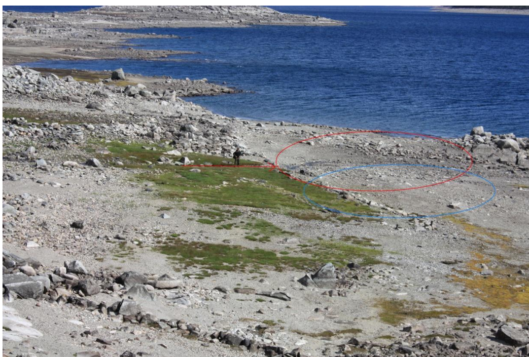
Oversiktsbilete med markert bekkeløp gjennom tufta (raud pil). Raud ring indikerer utvaskingsområde for funna. Blå ring er område der det meste av slagget ligg.

Lokalitetsgeometrien i Askeladden vart på bakgrunn av synfaringa oppdatert til å gjelde ei større flate nedanfor tufta, inkludert området med lause gjenstandar – sjå Bfk. nr. 14/104-106 og vedlagt utskrift frå Askeladden.