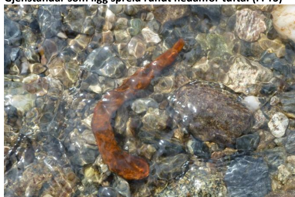
Gjenstand som ligg i bekkeløpet.

Lokalitetsgeometrien i Askeladden vart på bakgrunn av synfaringa oppdatert til å gjelde ei større flate nedanfor tufta, inkludert området med lause gjenstandar – sjå Bfk. nr. 14/104-106 og vedlagt utskrift frå Askeladden.