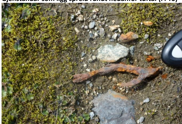
Krok av noko slag?