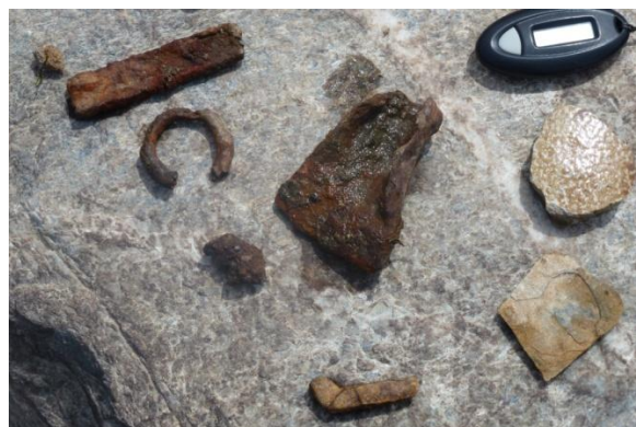
Gjenstandar som ligg spreid rundt nedanfor tufta.