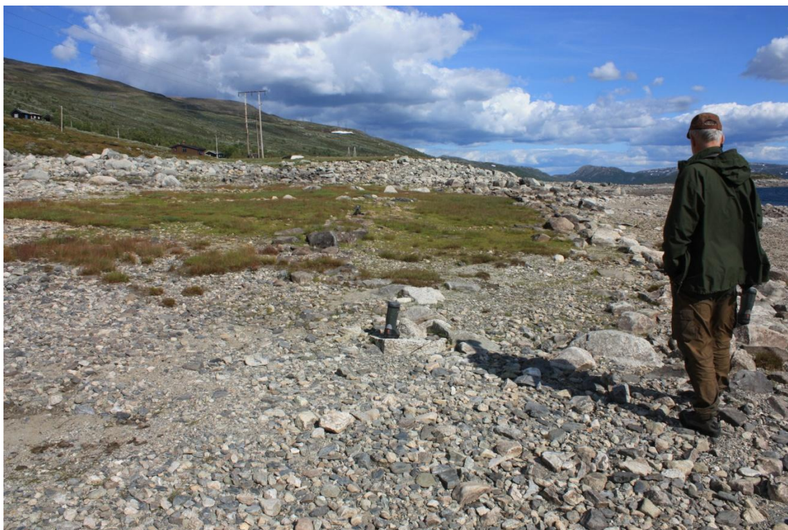
Tufta slik ho framstår i dag. Mogleg hjørnestein indikert med ein sko.

Ca. 30 meter nedanfor tufta, ved eit bekkeløp som kjem fram ved låg vasstand, vart det påvist ei mengd gjenstandar rundt i grusen. Dei fleste gjenstandane var ubestemmelege rustklumpar, men nokre og heilt tydeleg spikarar, hesteskosaumar og fragment av hestesko. Det vart og funne ein bit av eit velbrukt bryne og eit mogleg jernbeslag med ukjent opphav. Gjenstandane ser ut til å vera drege utover av den mindre bekken som renn gjennom tufta. Det er då nærliggande å tenke at ein del av gjenstandane er vaska direkte ut av tufta ved større vassføring. Bekken ser altså ut til å ha grave seg gjennom den austre delen av tufta på Øsmundset – Id 87719-1.