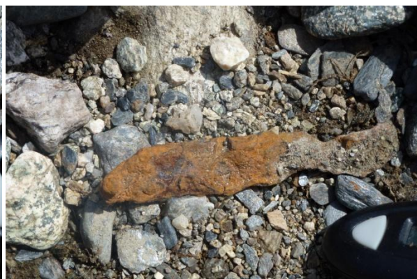
Mogleg sundrusta kniv?