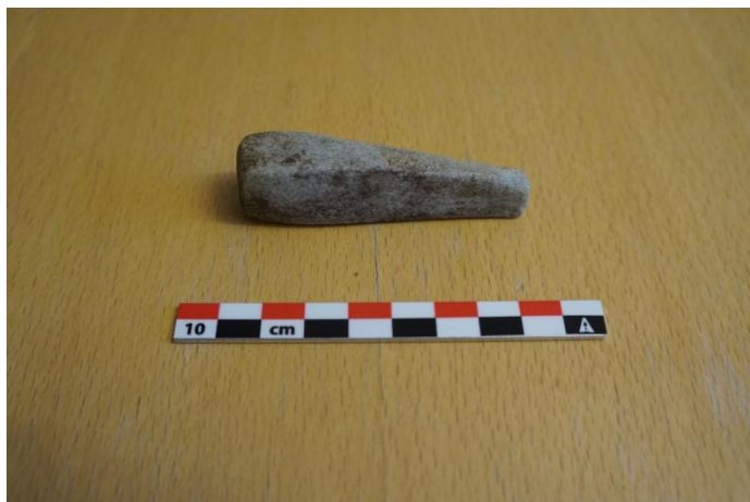
Id 87719-2. Lite bryne – BFK nr. 14_104

Gjenstandane vil bli sendt til Kulturhistorisk museum i Oslo for kontroll og eventuell magasinering.