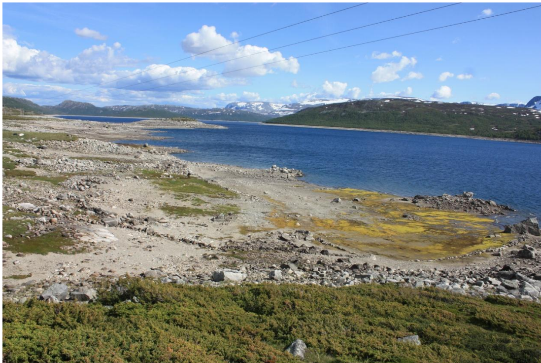
Øsmundset – oversiktsfoto. Det grønne området like til venstre frå midten av biletet er der tufta ligg. Heile området er omkransa av ein steingard – antagelig av nyare dato.

Under synfaringa vart det påvist ei mengd slagg like nedanfor tufta, merka i Askeladden som enkeltminne Id 87719-3. Av dei klumpane som vart plukka opp og sett på, såg det meste ut til å vera slagg frå eit såkalla fase 2 jernvinnenanlegg frå same periode som tufta. Ein slaggklump innehaldande innkapsla kol vart samla inn for eventuell datering.