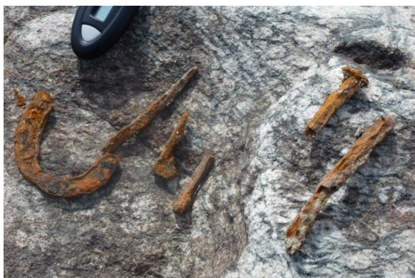
Gjenstandar som ligg spreid rundt nedanfor tufta. (F: TS)