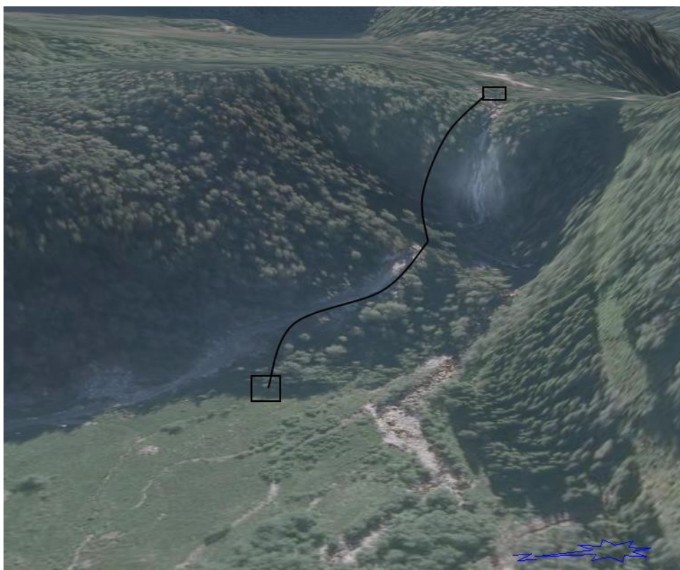
Flyfoto. Visualisering av prosjektet.

Inntaksbassenget på kote 200 er planlagt bygt i betong, bredde 12 meter og høyde 3 meter. Rørgata (lengde 335 meter) skal gå nedetter lia på nordsida av elva, deler av strekninga langs ein eksisterande skogsveg. Det er planlagt å forlenge vegen opp til inntaksområdet. Vegen vil bli planert som køyresterkt terreng, som etterkvart vil gro til. Kraftstasjon med grunnflate 70 m 2 skal plasserast på kote 80 med avløp til elva. Søkjaren tek sikte ein installasjon med 45% slukeevne rekna av middelvassføringa. Som alternativ er det gjort berekningar for ein mindre installasjon, 25% av middelvassføringa. Det er planlagt 130 meter jordkabel frå kraftstasjonen til 22 kV linja som går gjennom dalen.