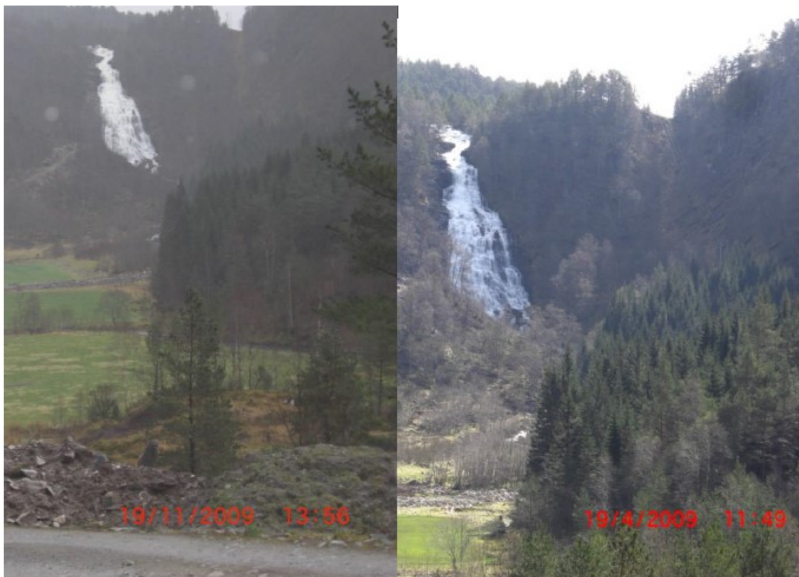
Figur 12, desse bileta illustrerer forskjellen på middelvassføring med og utan produksjon (1,7 m 3 /s middelvassføring med 0,77m 3 /s uttak) Bilete frå 19/11 visar ei vassføring på 1,66m 3 /s medan bilete frå 19/04 visar 0,90m 3 /s.

Det er per i dag liten til ingen fiskeinteresser i det råka området. Elva inneheld lite og små fisk. Det er i fylgje grunneigar M. Guddal fisk i vassdraget nedanføre Øyrafossen og det dreier seg då om det som ofte vert kalla gråkjø1 i Sunnfjordområdet2. Også oppe i Kalstadvatnet er det fisk og dermed også Kalstadelva ovanføre Øyrafossen. Overbefolkning pregar Guddalsvassdraget, så fisken er liten. Det er ikkje kjend eller truleg at Ål skal vere oppom fossen