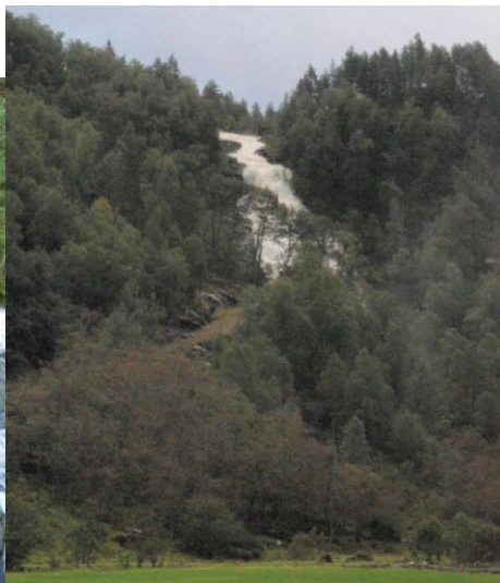
Fossen med skogsveg i framrunnen.