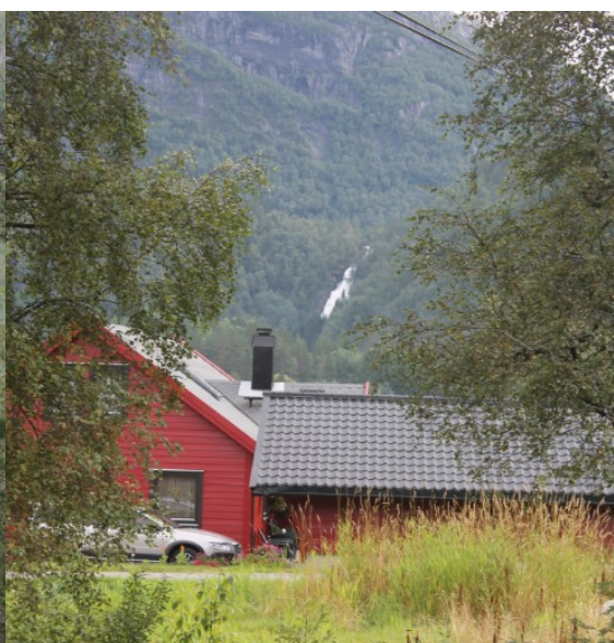
Venstre: Utsikt mot Øyra frå toppen av fossen. Høgre: Øyrafossen sett frå Engja. Foto 01.09.15. Idar Sagen