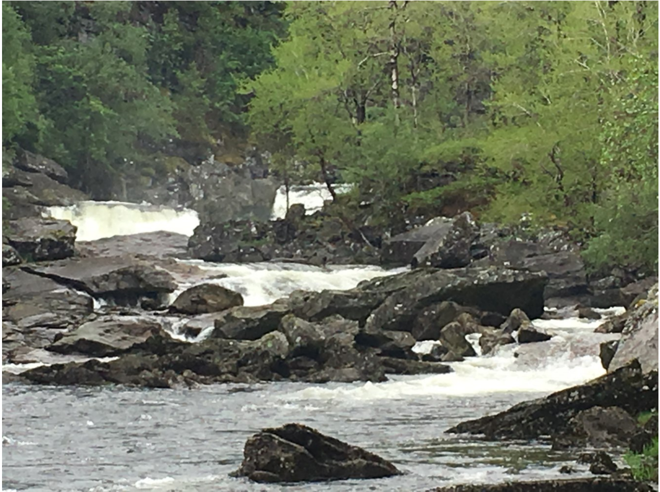
Yndestadfossen 31.05.2016