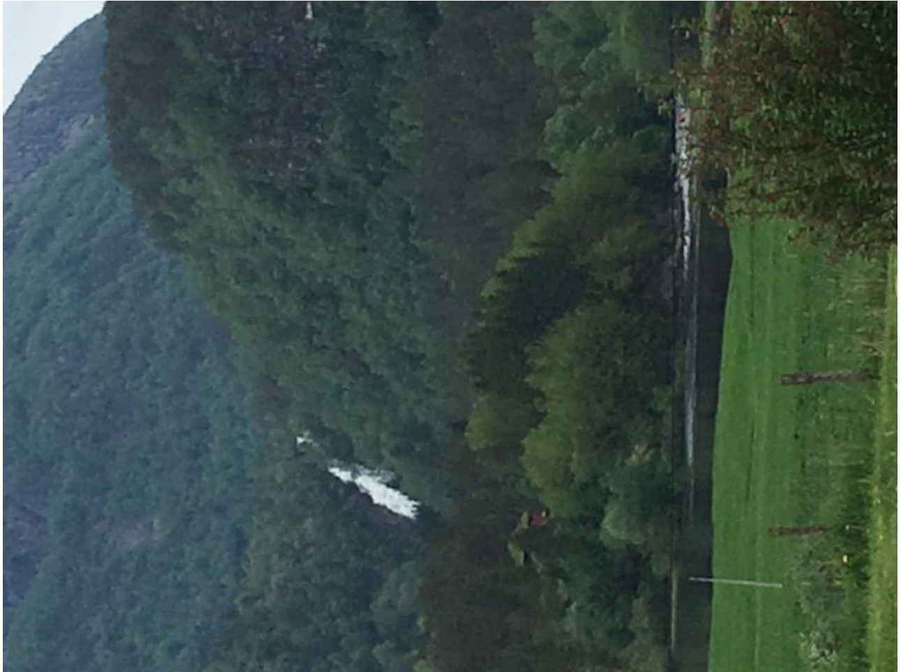
Øyrafossen 31.05.2016