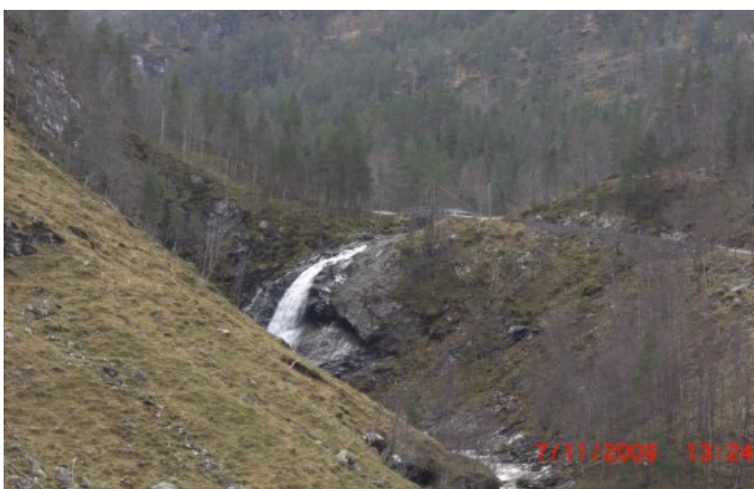
Figur 2, Vassføring: 0,65 m 3 /s