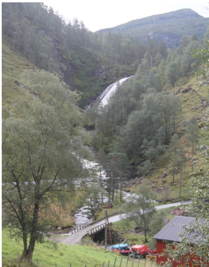
Svartefossen sett frå vegen opp til garden Svartefoss.