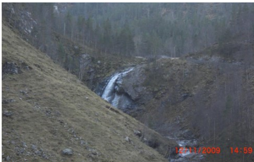
Figur 1, Vassføring: 0,25 m 3 /s