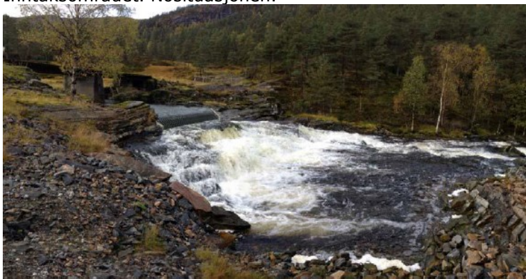
Inntaksområdet. Visualisering av terskel med rist nedstrøms.