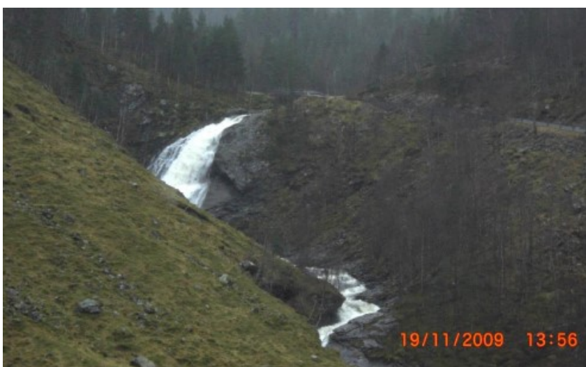
Figur 1, Vassføring: 3,5 m 3 /s

Alternativ 2 går ut på å etablere inntak eit stykke nedanfor fossen, på kote 190. For begge alternativa er det planlagt kraftstasjon under bakkenivå med kontraroterande turbin, grunnflate ca. 16 m 2 . Eit lite hus over bakkenivå vil gje tilkomst til stasjonen. Eksisterande skogsveg ned til