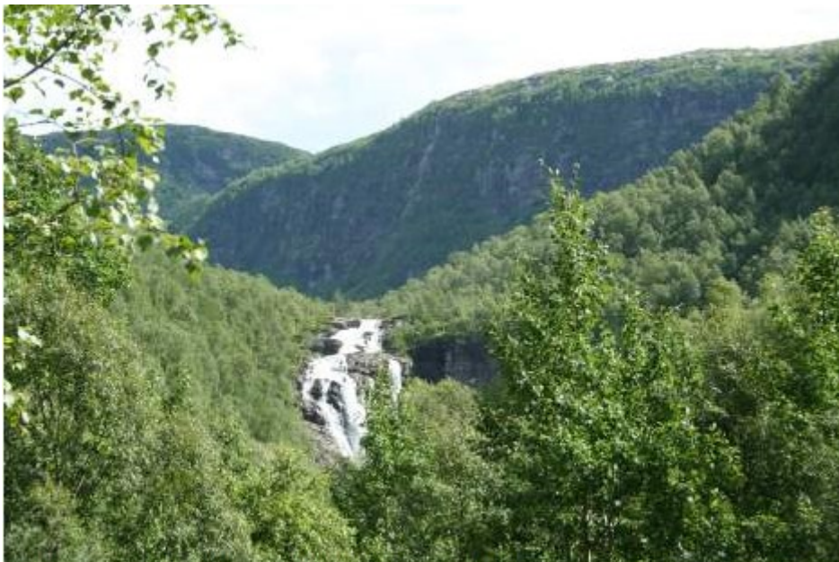
Sørebøfossen. (Foto: Juli 2010, Sylvia Smith-Meyer, NVE).

Sørebøelva omfatter sørøstre del av Guddalsvassdraget og renner ut i dette ved Sørebøen, ca. 8 km ovenfor Guddal. Sørebøelva har flere vann og de to hovedelvene møtes ved Skredvatnet (463 moh.). Herfra går elva i stryk og fosser ned til samløpet med hovedelva. Sørebøfossen skiller seg ut som et særlig markert landskapselement. Med bakgrunn i at vassdragsvern i størst mulig grad bør omfatte hele vassdrag, ble sidevassdraget Sørebøelva tatt inn i verneplanen ved supplering av Verneplan for vassdrag.