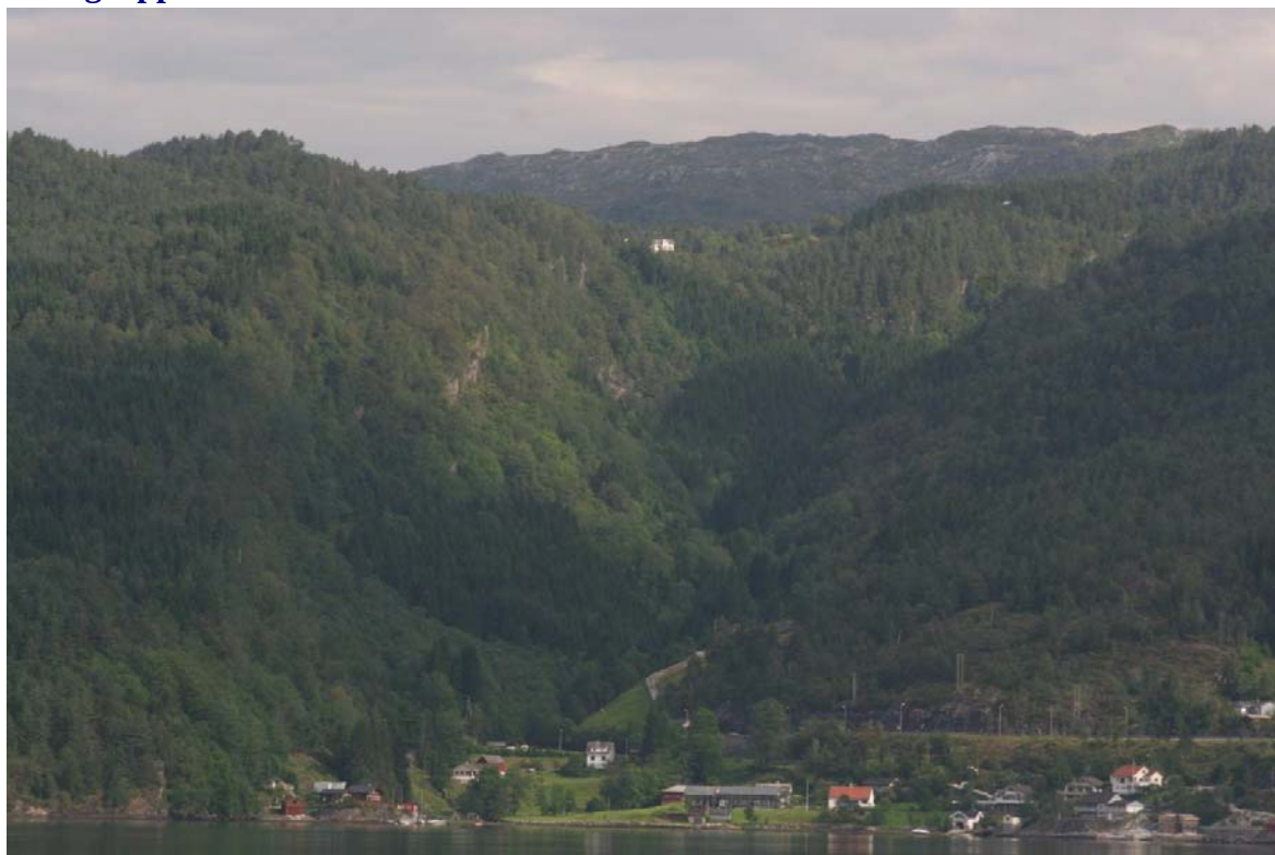
Bilde 2.1 Uten kraftstasjon