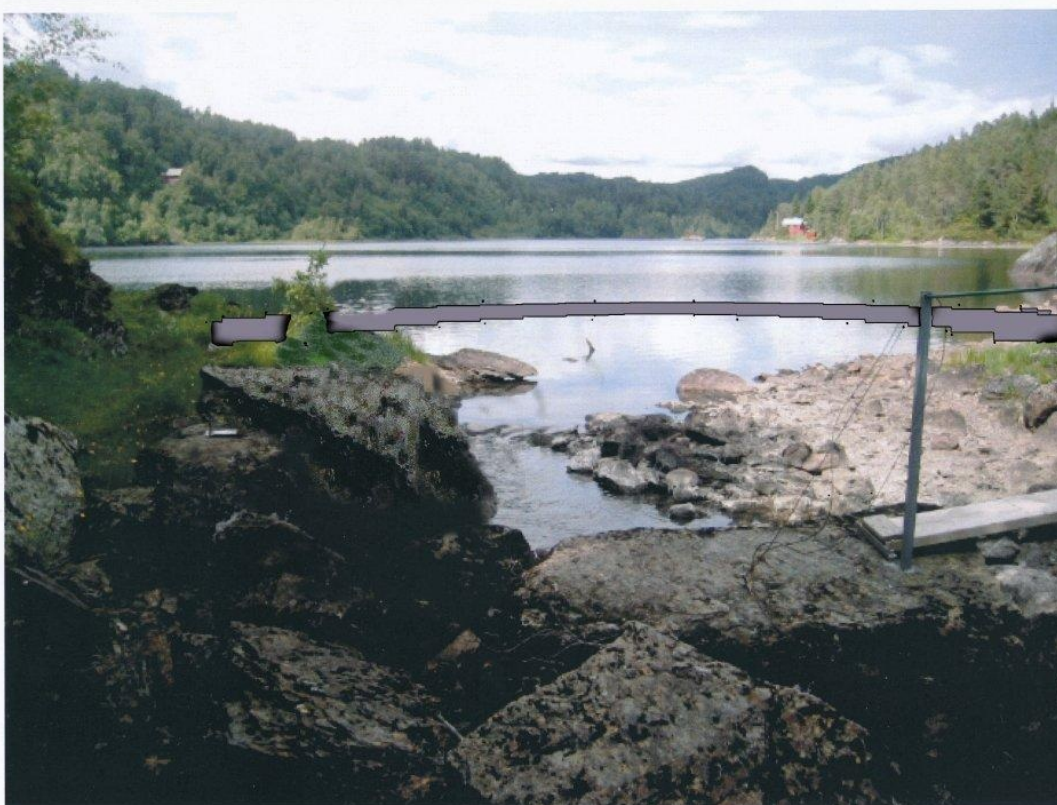
Bilde 1.2 Fitjavatnet med dam