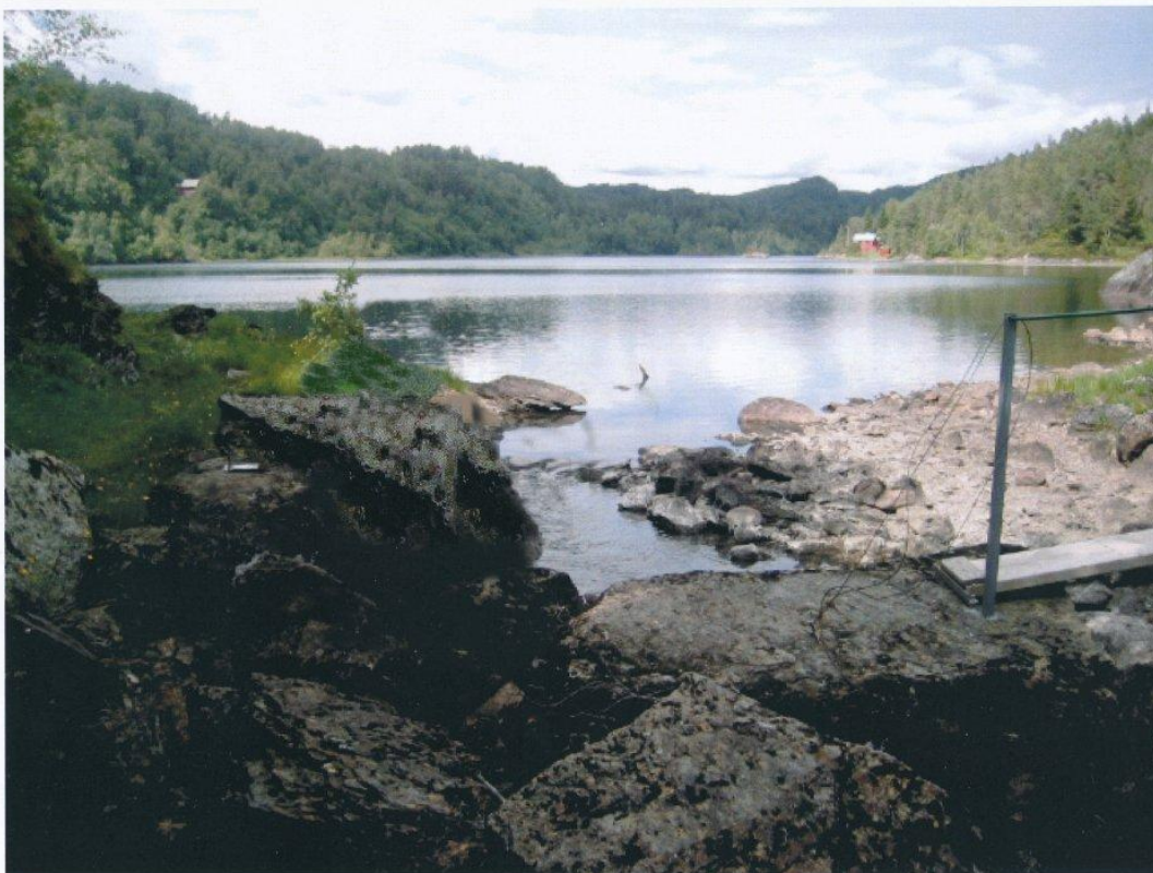
Bilde 1.1 Fitjavatnet uten dam