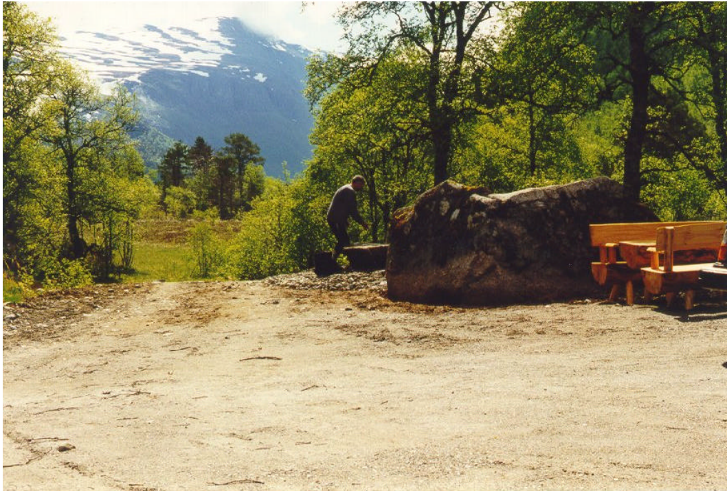
Bilde 1: Tilrettelagt parkeringsplass øvst i tilkomstsona.

Ca 2 km skogsbilveg. Området er prega av aktivt skogbuk. Furu og gran dominerer. Parkeringsplassen er godt skjerma frå vatnet (Stølssona) og fint opparbeid og tilrettelagt. Den gamle stølsvegen/stien er tilgjengeleg men ikkje avmerkt på kart.