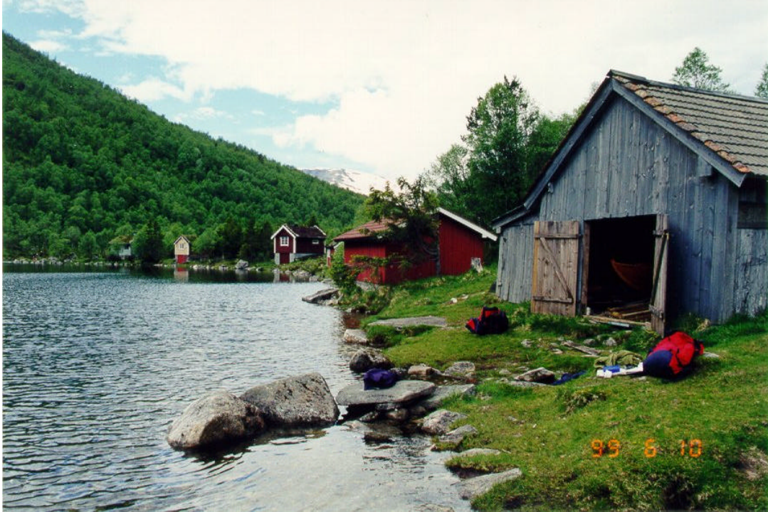
Bilde 2: Osen i nordenden av Langedalsvatnet. Her kan ein leige båt og kjøpe fiskekort.