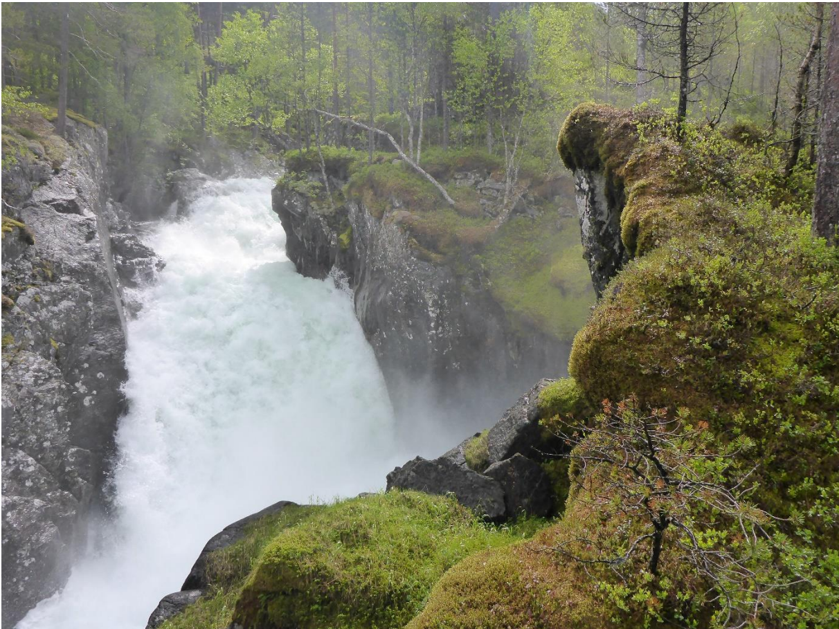
Figur 2: Naturtypeavgrensningen fossesprøytsonen Skare.

I verdibegrunnelsen fra Ecofact er det for begge naturtypene lagt vekt på at verdien forringes noe på grunn av forekomst av veier (bekkekløften) og at området er påvirket av hogst og plantefelt (bekkekløften og fossesprøytsonen).