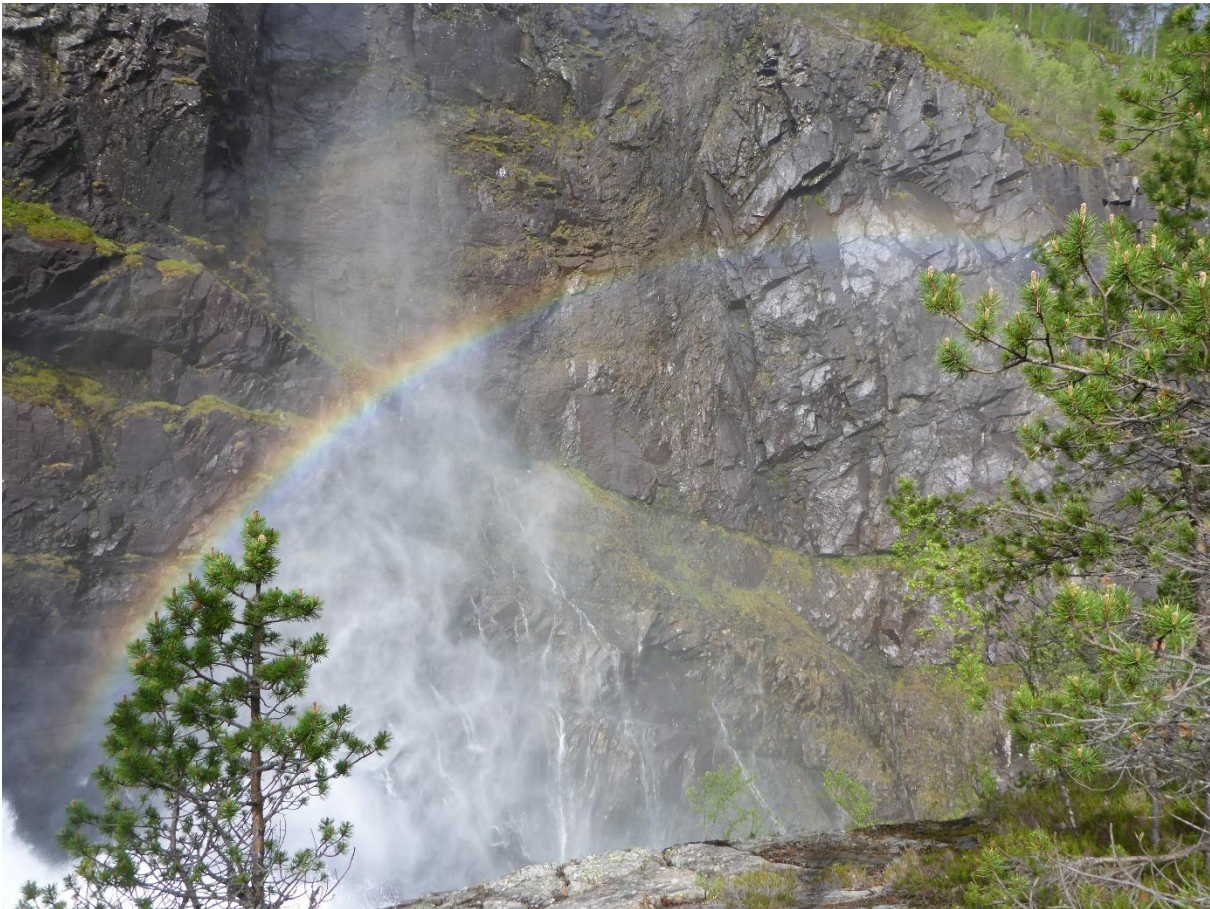
Figur 1: Fossesprøytsone i naturtypeavgrensningen bekkekløft og bergvegg (Skare S).