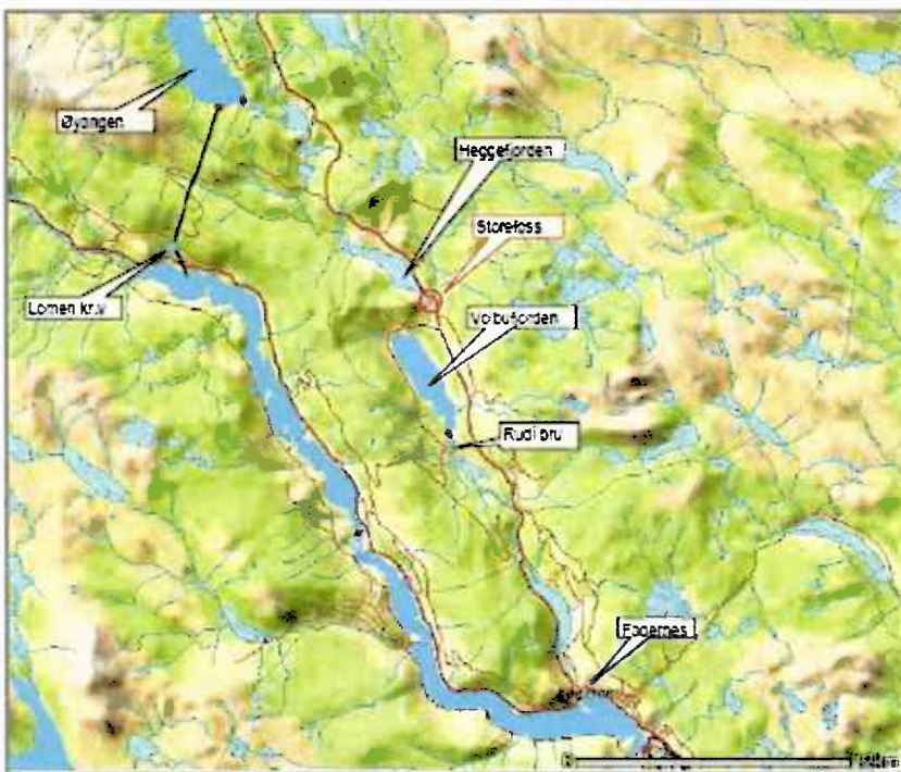
Figur 1. Lokalisering av tiltaket.

Omsøkte utbyggingen omfatter overføring av vann fra Vinda til Vala (Heggefjorden) ovenfor Storefoss (figur 3). Fra inntaket i Vala på kote 482,5 føres vannet i en ca. 130 meter lang nedgravd rørgate til kraftstasjonen på kote 464. Kraftverket vil få en effekt 2,0 MW og vil kunne produsere 6,2 GWh årlig, hvorav 26 % vil være vinterkraft. Søker vil bygge en 180 meter lang veg til kraftstasjonen. Kraftverket blir tilknyttet eksisterende linjenett via en 50 meter lang jordkabel. Søker foreslår å slippe ei samla minste-vassføring i Vala og i Vinda på 630 l/s om sommeren og 340 l/s om vinteren. Det er òg søkt om konsesjon etter energilova for bygging og drift av Storefoss kraftverk med tilhørende koplingsanlegg og kraftlinje. Utbyggingskostnaden er anslått til 4,1 kr/kWh, totalt 25,6 mill kr.