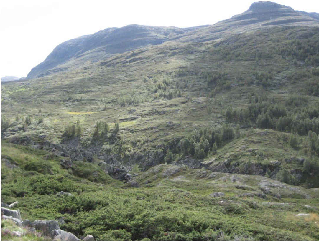
Bilde 8: Flatt området oppe til venstre i bildet tenkt som riggområde