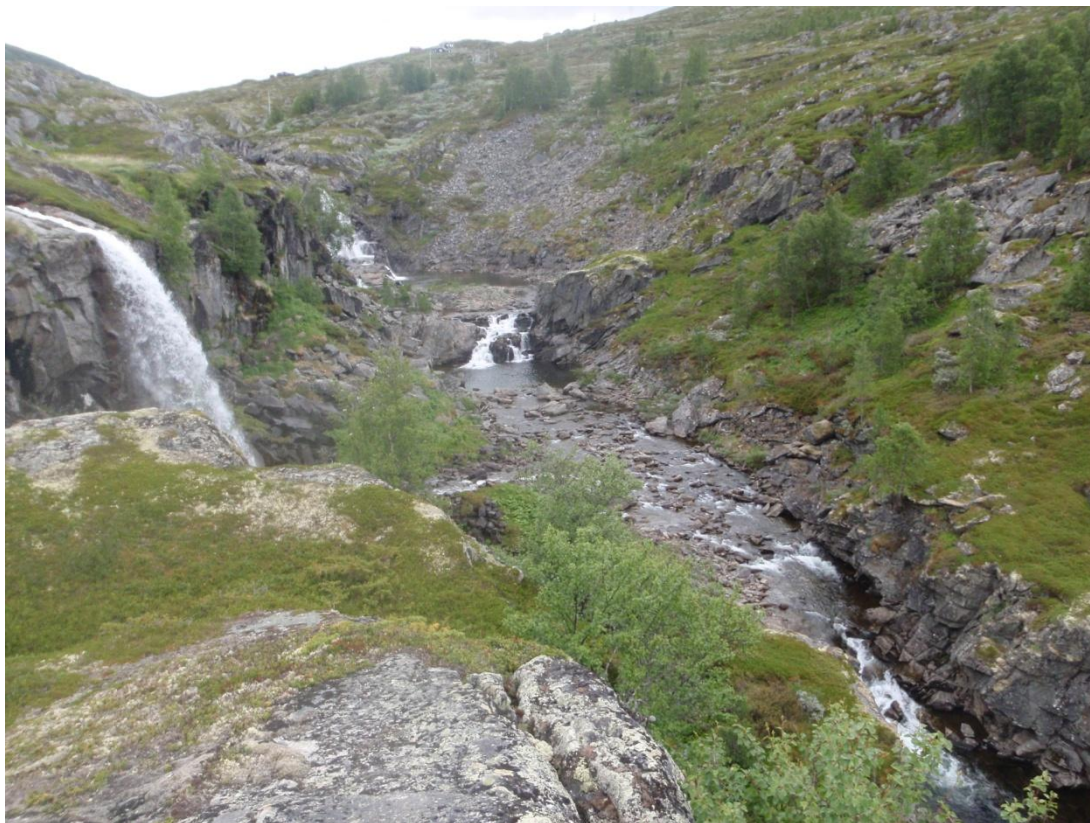
Bilde 4: Området for inntaksbasseng. Deler av området renskes/graves ut. Galdestøfossen og fossesprøyten vil bevares.