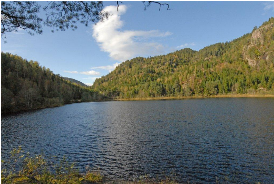
Bilde viser eksisterende inntaks magasin Holdt Kraftverk.