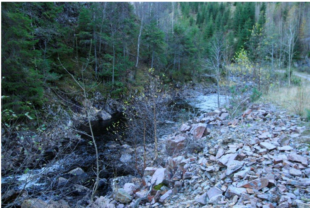
Bilde viser elv rett nedstrøms damanlegg ved nedre Blæsa. Rørgata er planlagt lagt i veibanen til høyre i bilde.