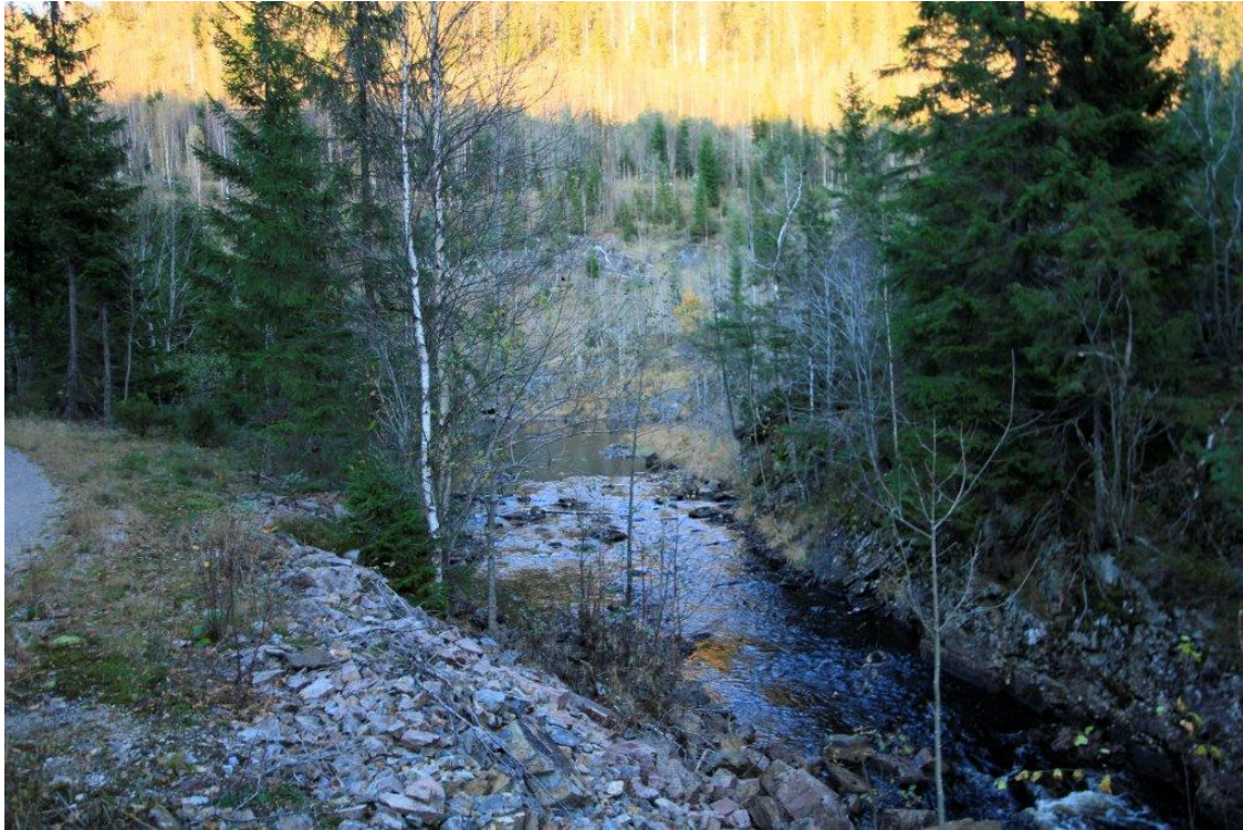
Bilde viser elv øvre halvdel Holdt Kraftverk. Rørgate er planlagt lagt i veibane til venstre i bilde.