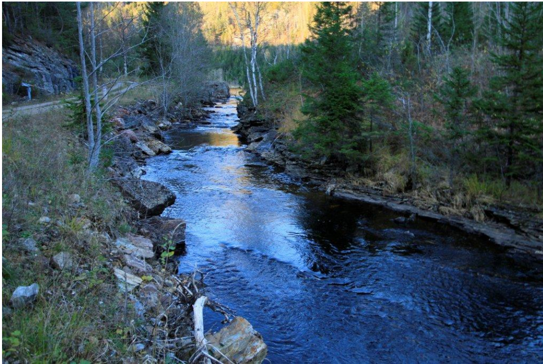
Bilde elv nedstrøms dam med inntaksdammen i bakgrunn. Rørgata er planlagt lagt i vei høyre side.