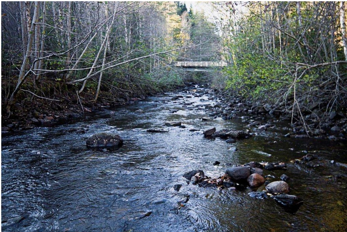
Bilde viser elveløp rett oppstrøms kraftverks plassering.