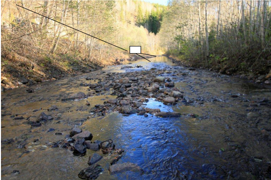
Bilde viser kraftverks plassering Holt Kraftverk. Med avløp til Stulenvatn.