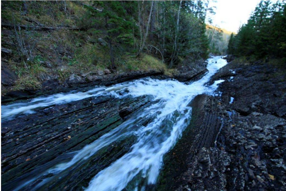
Bilde viser elveløp ca halvveis mellominntak og kraftverk. Rørgate er planlagt i vei 20-30 m fra vassdrag.