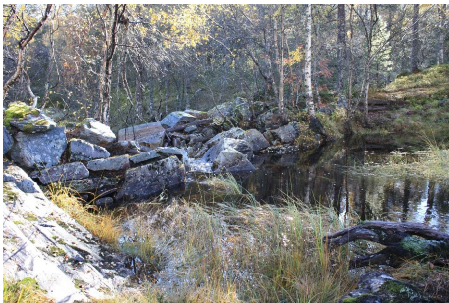
Restar etter gammel demning ved utløpet frå Solheimsvatnet.

Frå eksisterande stølveg er det nødvendig å ruste opp eit stykke skogsveg til bilveg og å bygge ca. 300 meter ny bilveg til inntaket. Det må også byggast ca. 300 meter ny bilveg frå fylkesveg