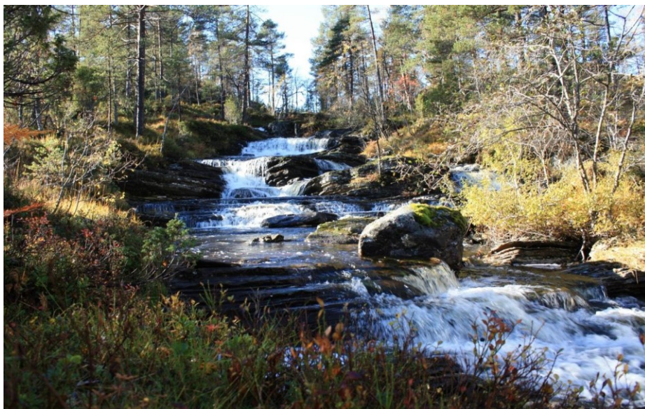
Småfossar i elva mellom Solheimsvatnet og øverste brua på skogs-/stølsvegen.

615 og ned til kraftstasjonen ved vatnet. Om lag 400 meter jordkabel skal leggest frå kraftstasjonen og opp til ein transformatorstasjon ved fylkesvegen.