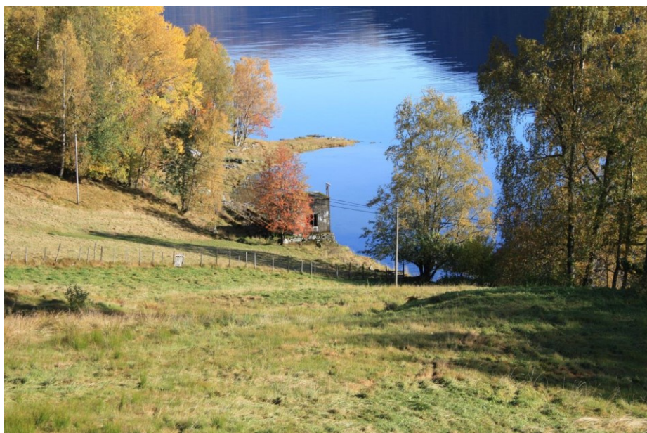
Frå fylkesvegen og nedover til Storefjorden. Restar av gammal kraftstasjon.