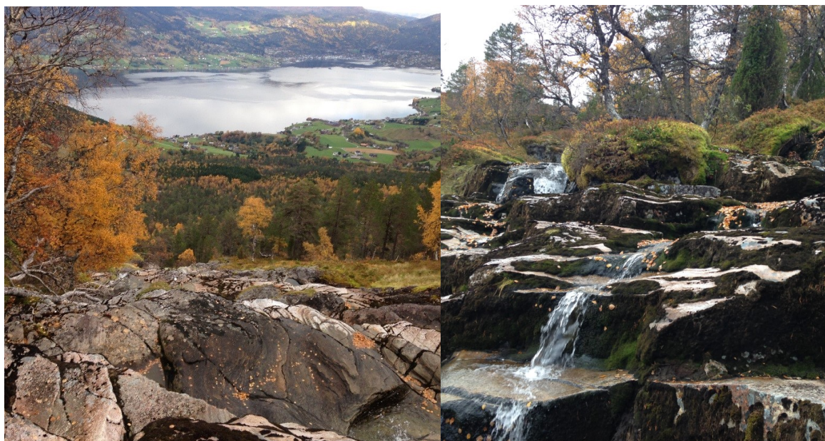
Kvitfella. Venstre: Utsikt frå toppen av Fossehyllene. Høgre: Sett oppover. Foto I. Sagen, 18.10.15.