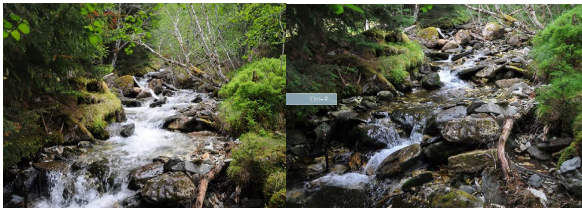
Daufosselva like ved stølsvegen i juni og juli 2013. 90 liter/sek og 30 liter/sek