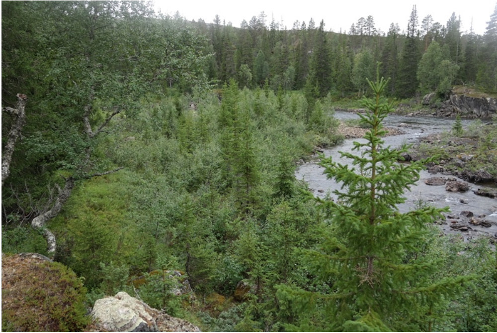
Figur 3 Gjengrodd elveleie i Namsen

Når det gjelder tersklene er disse tekniske inngrep i parken, disse er etablert i flate deler av elva og sikrer vannspeil som danner lengre sammenhengende flyer. Det er planer om å etablere terskel lengre opp i Namsen (Kariflyan), men dette blir utenfor verneområdet.