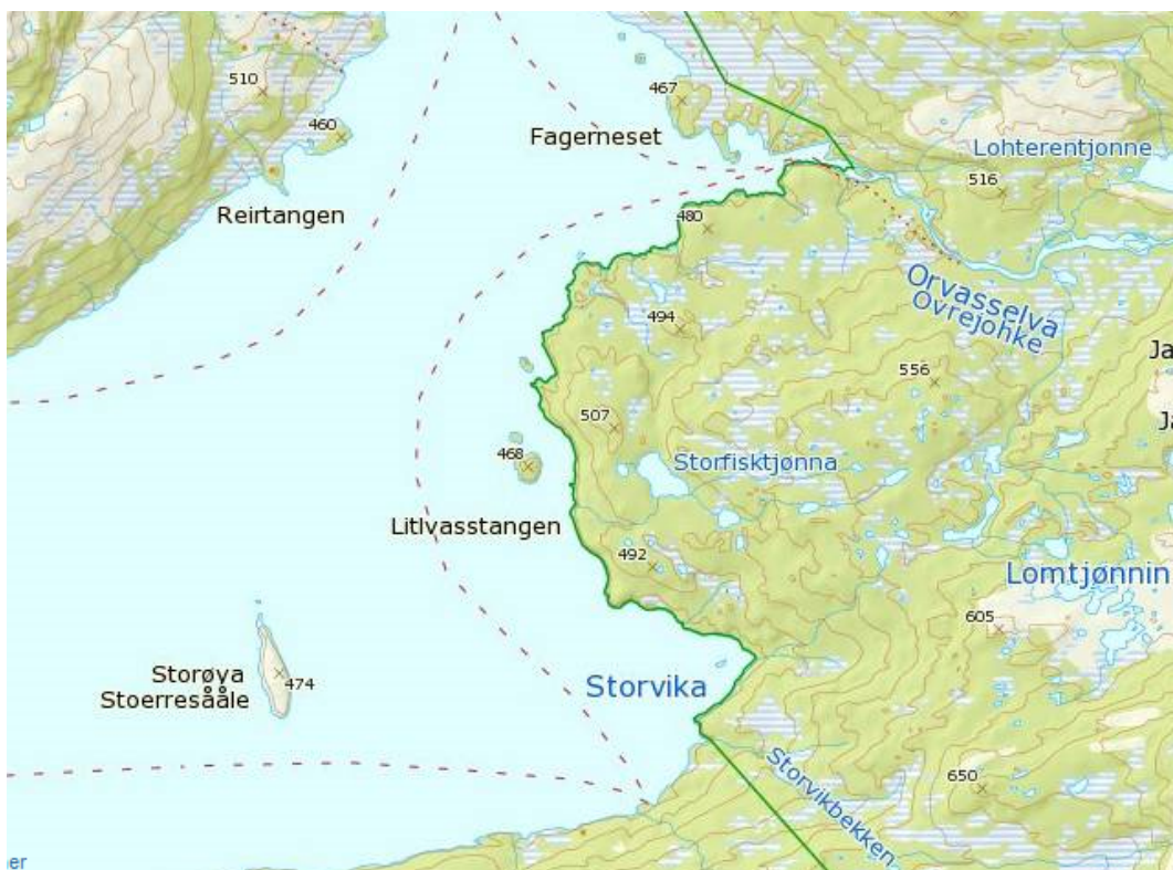
Figur 2 Nasjonalparkgrensen lang strandsonen øst i Namsvatnet

I august 2014 ble det gjennomført befaring lang Namsen. Befaringen ble gjennomført på strekningen fra Storfossen i Namskroken og opp til Helvetesfossen. Strekingen innbefatter 2 terskler som er bygd av regulanten som sikrer vannspeil over en større område. Befaringen ble gjennomført i periode med mye nedbør og større vannføring.