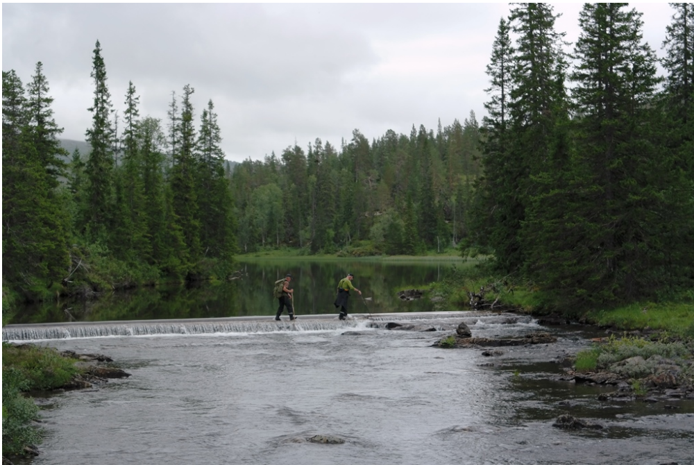
Figur 4 Terskler nedstrøms Nerflya

Når det gjelder tersklene er disse tekniske inngrep i parken, disse er etablert i flate deler av elva og sikrer vannspeil som danner lengre sammenhengende flyer. Det er planer om å etablere terskel lengre opp i Namsen (Kariflyan), men dette blir utenfor verneområdet.