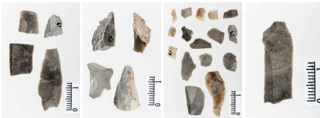
T 20981. Funn av flintredskaper fra steinalderlokalitet 4 A, Foldsjøen. Delvis undersøkt i 1986 av Lil Gustafson.

Med en endret reguleringsgrense fra HRV 208,9 til 204 vil områder som i dag ligger under vann bli blottlagt. Eventuelle kulturminner vil da ligge i en erosjonssone og vil kunne være utsatt for skader i de områder hvor det er store svingninger mellom HRV og LRV.