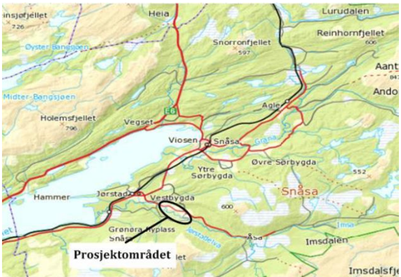
Figur 1: Kartutsnittet viser prosjektområdet for Jørstadelva kraftverk. Nærmeste tettsted er Snåsa 12 km nord for prosjektområdet.

Prosjektområdet for Jørstadelva kraftverk er lokalisert på sørsiden av Snåsavatnet. Fylkesvei 763 passerer over elva oppstrøms for utløpet i Snåsavatnet, mens fylkesvei 322 følger elva sørøstover.