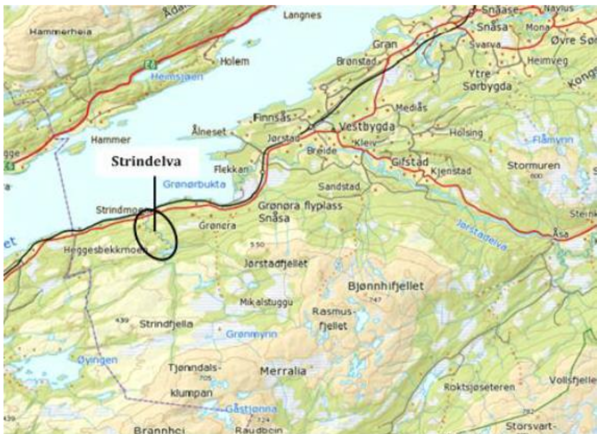
Figur 3: Kartutsnittet viser prosjektområdet for Strindelva kraftverk.

Prosjektområdet for Strindelva kraftverk ligger sør for Snåsavatnet i Snåsa kommune. Prosjektområdet ligger ca. 16 km (luftlinje) sørvest for tettstedet Snåsa.